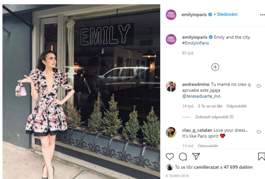
Obr. 3. 9

Již z dosud představených poznatků je tedy patrné, že dvěma klíčovými strategiemi při propagaci Emily in Paris byly více či méně subtilní intertextuální odkazy na jiné populární televizní série a ikonická Paříž. Z materiálů v obdobném duchu sestává i oficiální Instagramový profil seriálu, který se pyšní v tuto chvíli již ne příliš překvapujícím popiskem, „od tvůrce Sexu ve městě “. 8 Na pařížské dobrodružství Američanky Emily publikum začal lákat v dubnu 2019 (čili více než rok před jeho samotným uveřejněním na streamovací platformě) a byť aktuální nebo obecně novější publikované fotografie či videa k Sexu ve městě tak explicitně neodkazují, jednoduché popisky úplně prvních příspěvků na něm byly v podstatě celé založeny – viz. obr. 3 a 4.