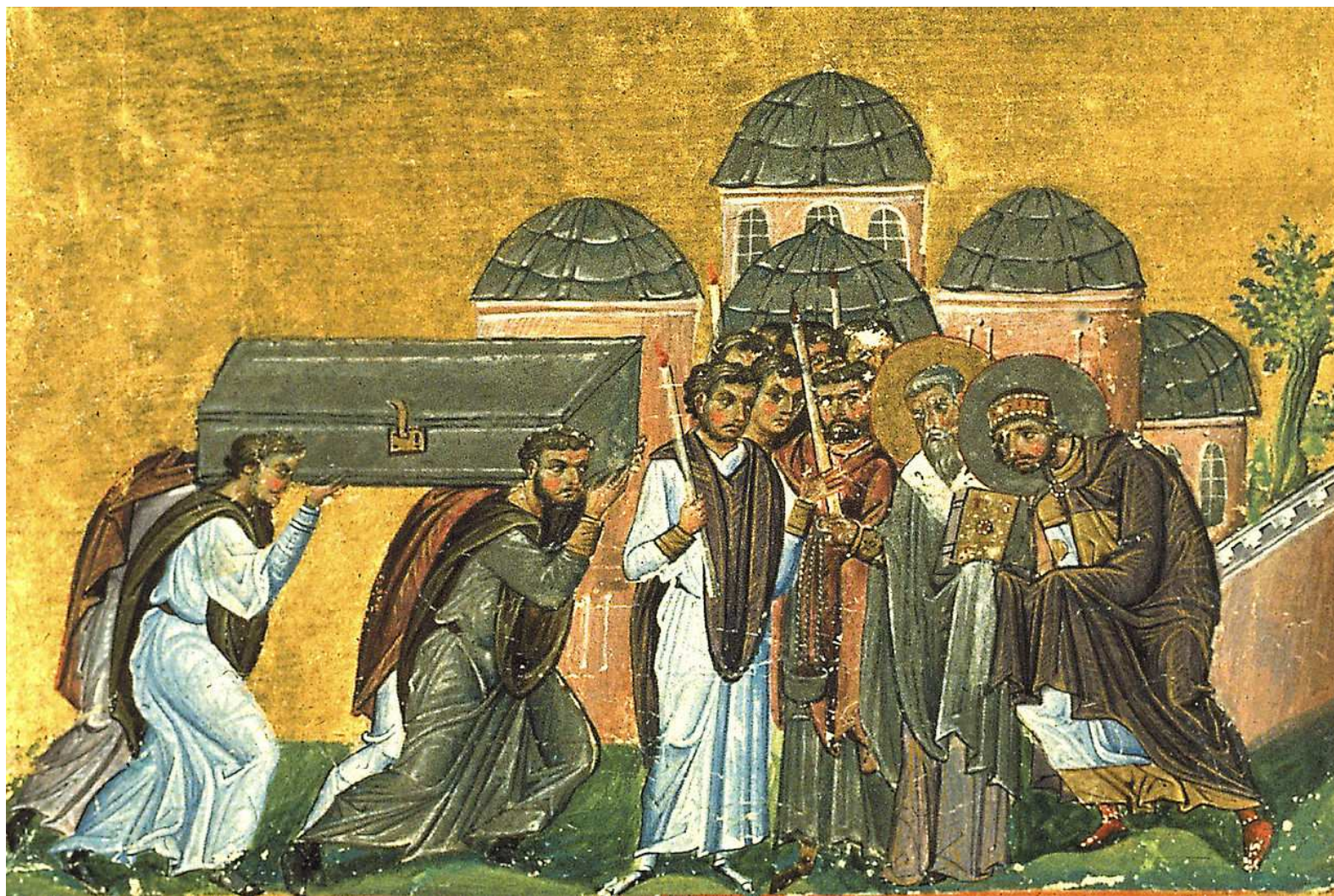
12 Svátí a jejich kult ve středověku