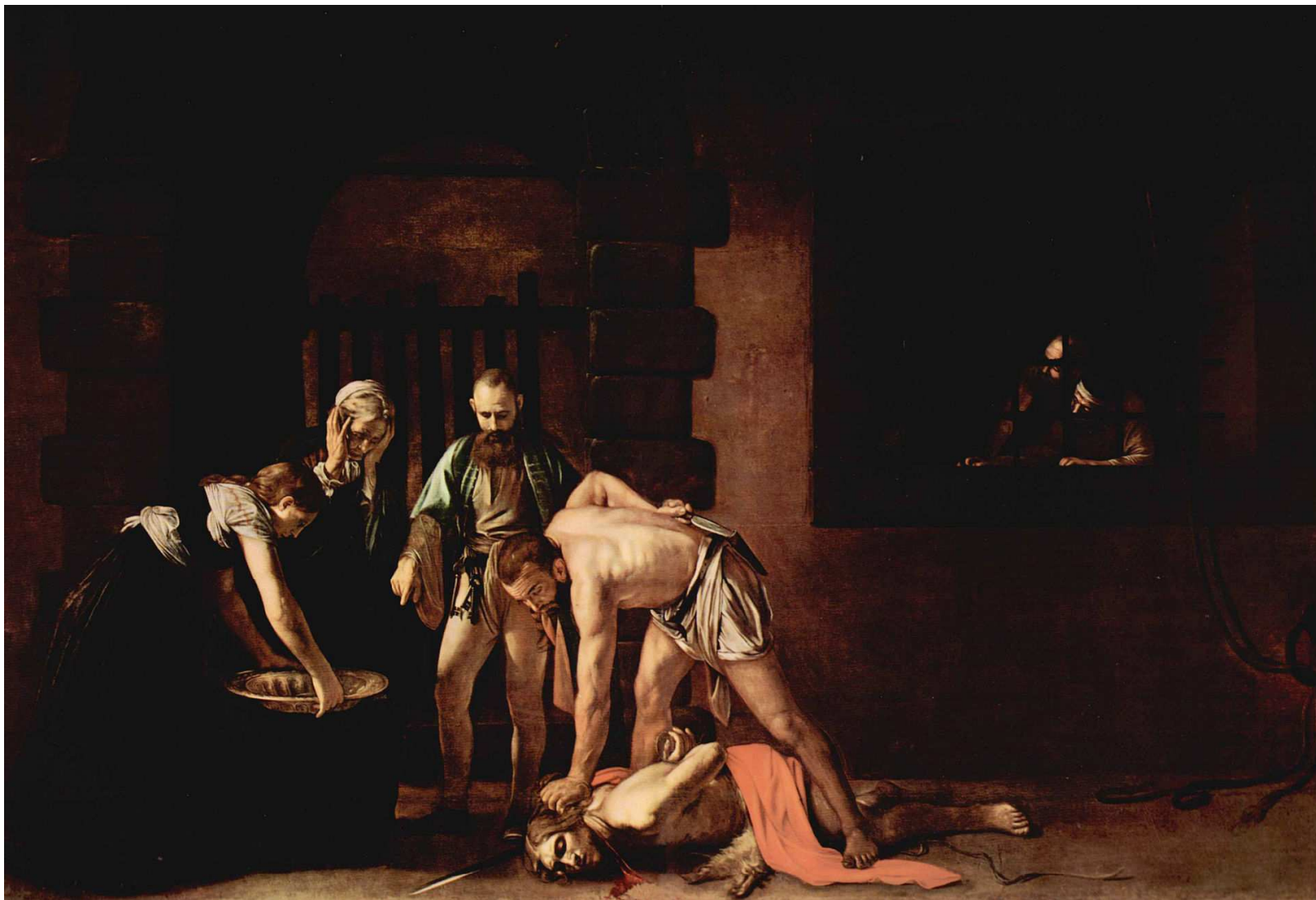
5 Svatí a jejich kult ve středověku