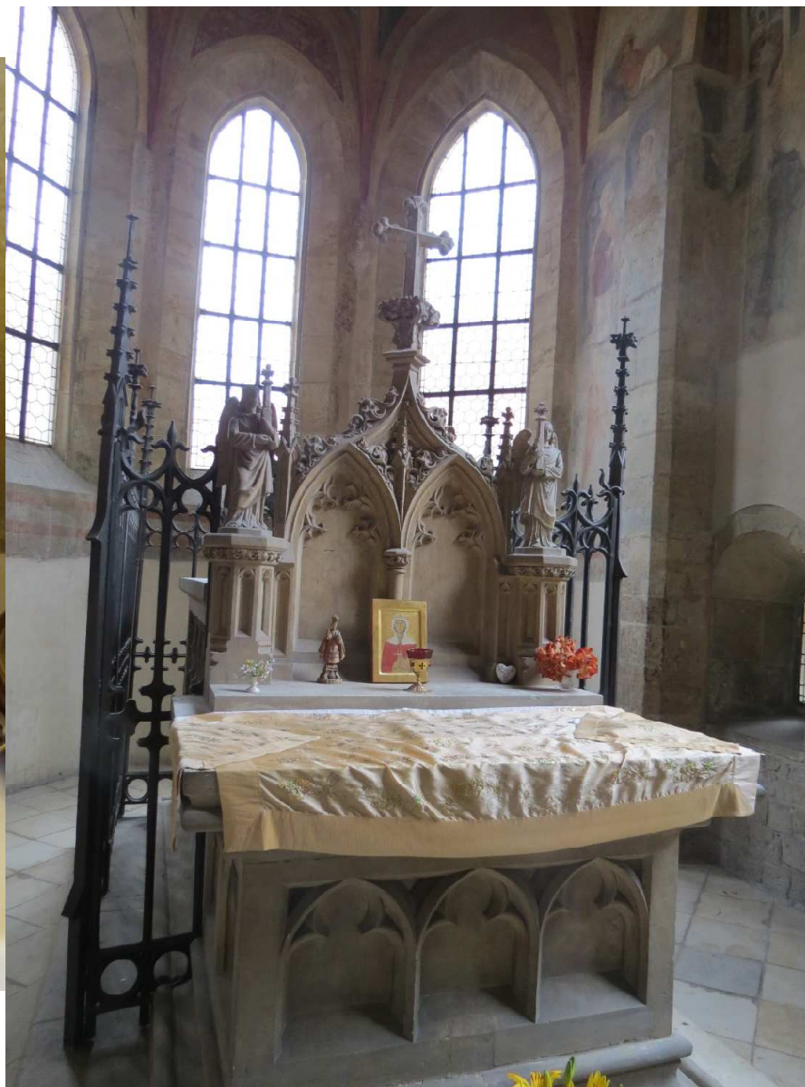
9 Svatí a jejich kult ve středověku