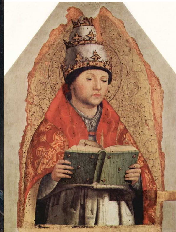
13 Svatí a jejich kult ve středověku