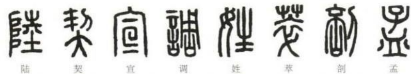
部分结构对称篆字：