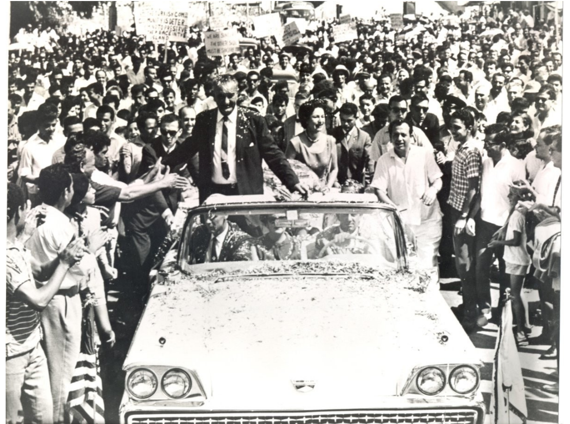
L. Johnson při návštěvě Kypru v roce 1962