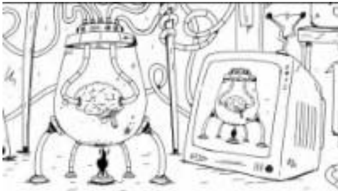
Animované vysvětlení myšlenkového experimentu „mozek v kádi“ ( https://www.youtube.com/watch?v=z00sSJB1Tri&list=PL1NXgjXDUNJk_51d5AJzCj0Ri7avL5E9W )

▪ radikální → mozek v kádi („brain in vat“, BIV) – popření spolehlivosti všech poznatků