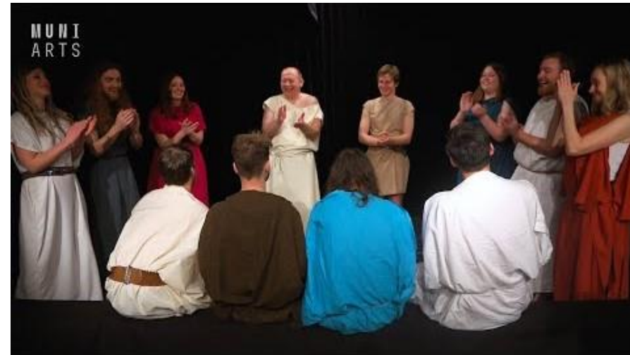
Ukázka argumentačních faulů v podání antických eristiků: https://www.youtube.com/watch?v=JnRv_-gsOVs