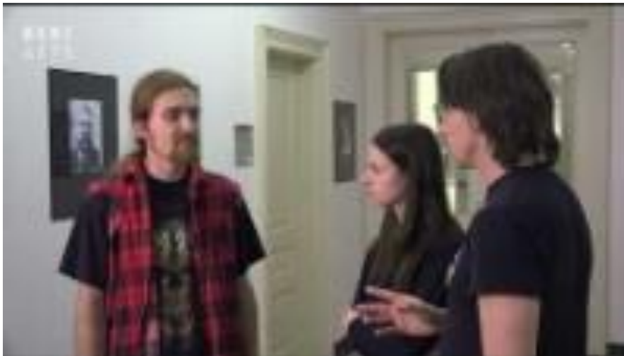
Argumentační fauly dnes: https://youtu.be/XXz3Odqr7nE