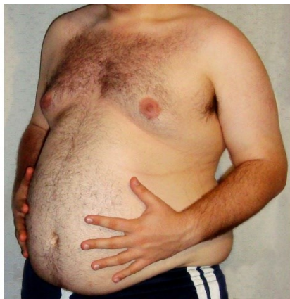
9. Ten mężczyzna jest .....