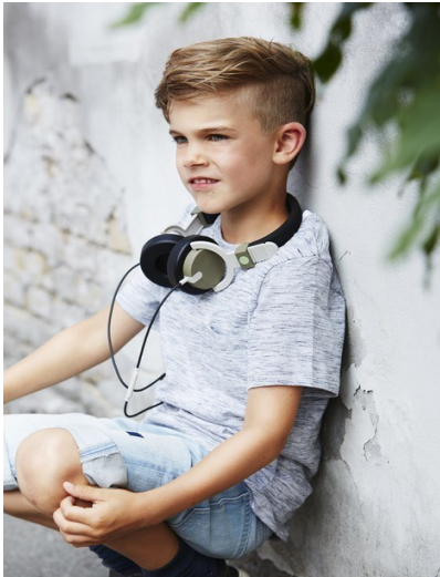
1. Ten chłopiec jest .....