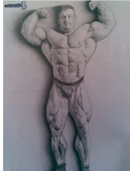
8. Ten człowiek jest .....