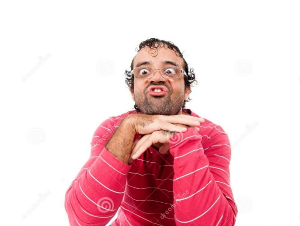
5. Ten mężczyzna jest .....