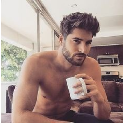
7. Ten mężczyzna jest .....