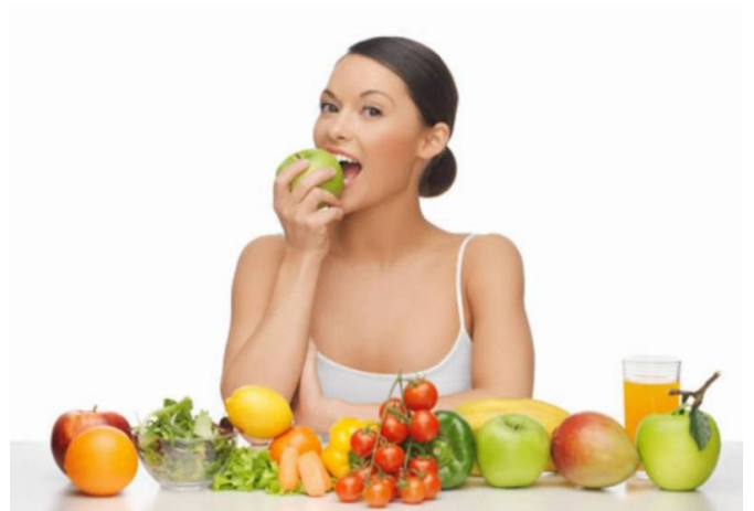
4. Ta kobieta jest .....