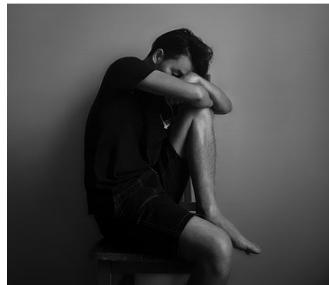
12. Ten chłopiec jest .....