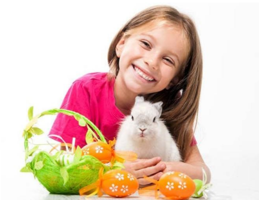
11. Ta dziewczynka jest .....