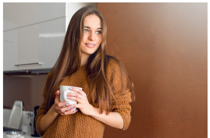
6. Ta kobieta jest .....