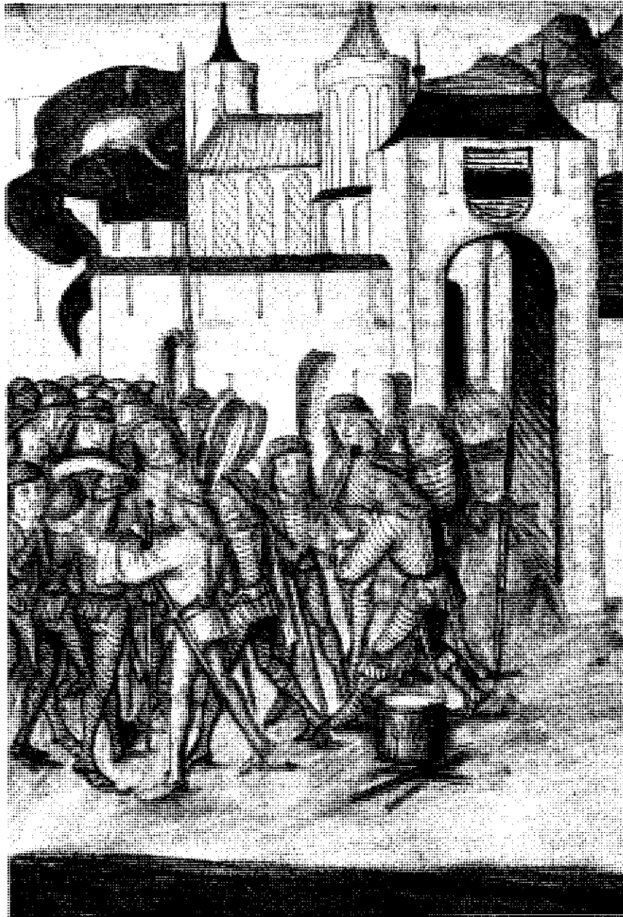
3 Die Besammlung der Gesellen im «torechtigen Leben» vor Zug. Detail aus einer Illustration aus der amtlichen Ausgabe der Berner Chronik des Diebold Schilling (Hs. B).