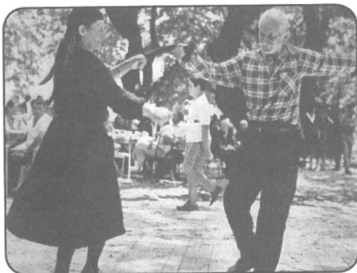
Φωτογραφία του σπουδαίου Έλληνα φωτογράφου Κώστα Μπαλάφα