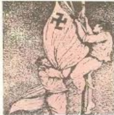
Ο Μ. Γλέζος και ο Α. Σιάπας κατεβάζουν τη γερμανική ση- μαία από την Ακρόπολη Σχέδιο της κατοικής περιόδου