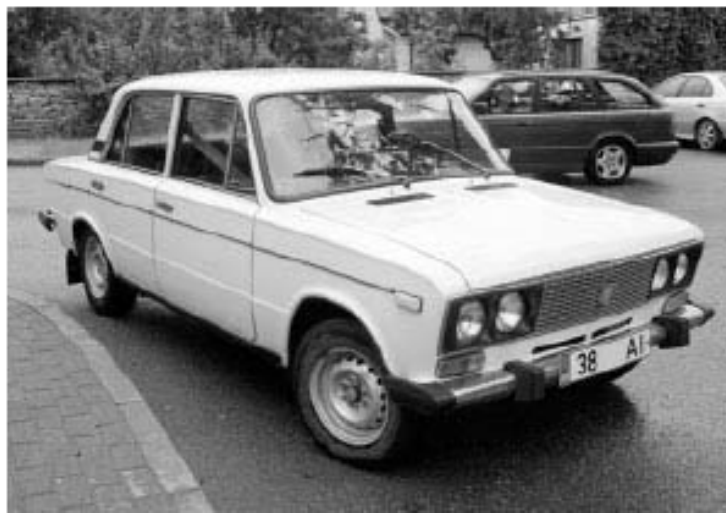
Это старая русская машина.