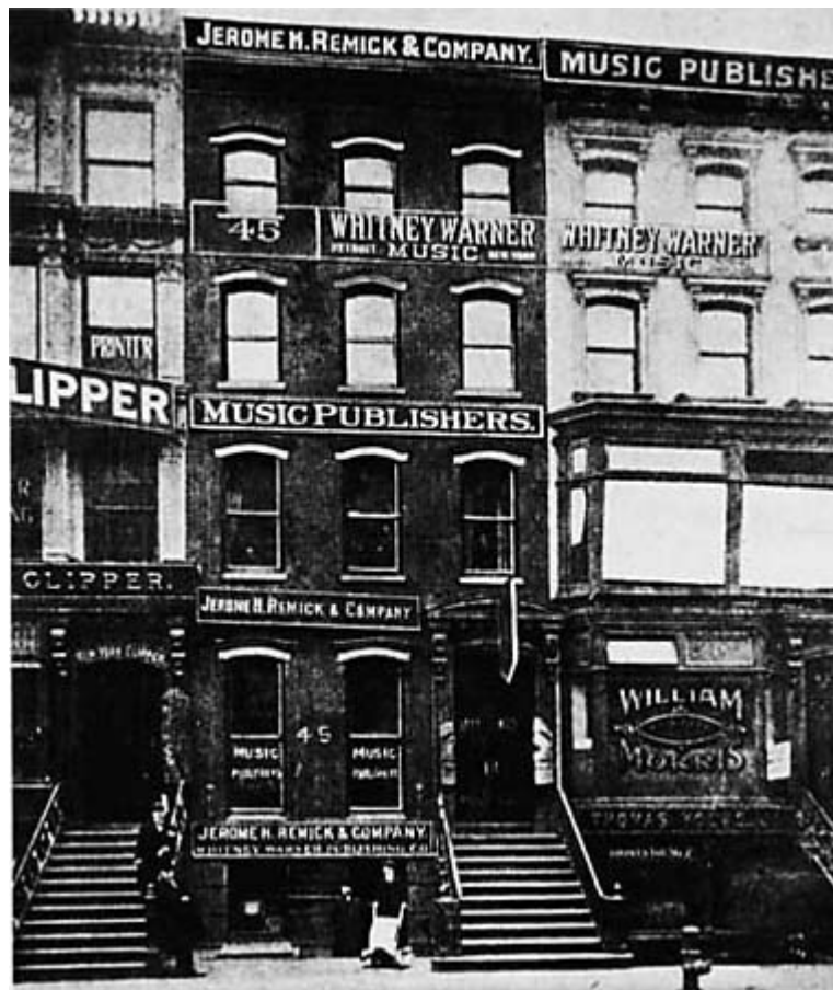
Tin Pan Alley roku 1910