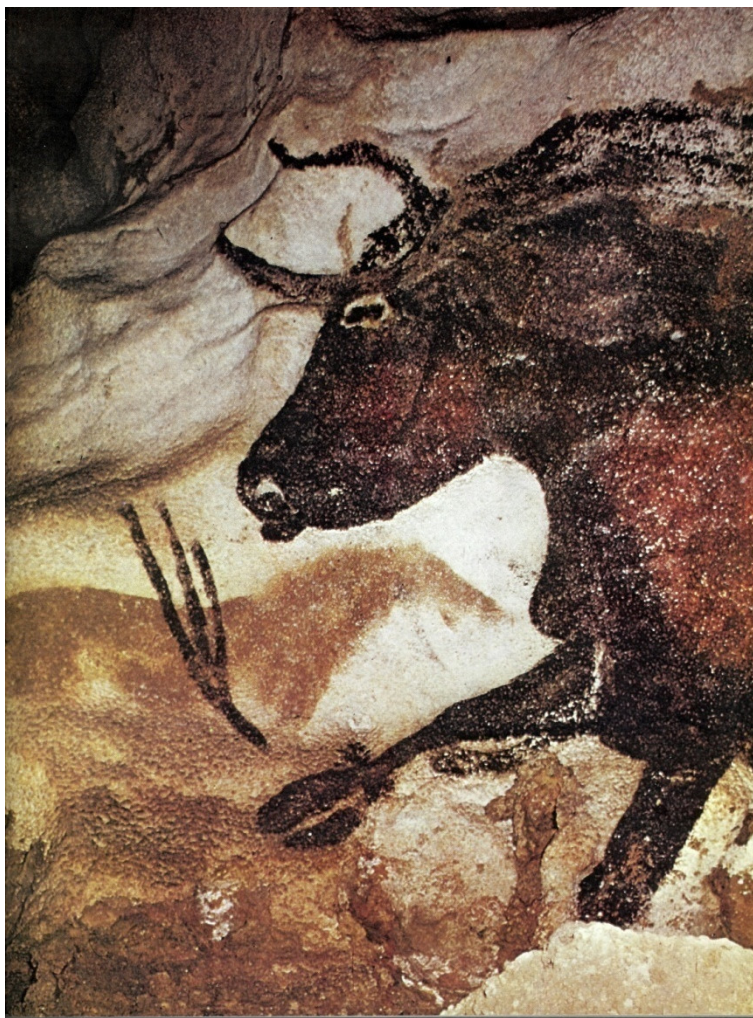
Fragment skalních maleb z jeskyně Lescaux (Francie)