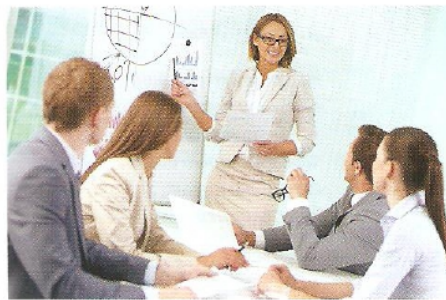
директор, директорка менеджер