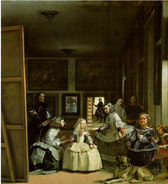
„Las Meninas“ (Das Hoffräulein) von Diego Velázquez (1656).

Das Bild des spanischen Malers Diego Velázquez hängt im Museo del Prado in Madrid. Von diesem Bild ausgehend, entwickelt Michel Foucault im 1. Kapitel von „Die Ordnung der Dinge“ seine Repräsentationsthese (für die klassische Episteme) und zeigt anhand seiner Bildinterpretation, dass der Mensch als erkenntnistheoretisches Subjekt noch nicht existiert. Dieses Bild fungiert quasi als Aufhänger des gesamten Buches. In späteren Kapiteln, worin er die Episteme der Moderne beschreibt, greift Foucault erneut auf „Las Meninas“ zurück, um die ‚Geburt‘ des Menschen vorzuführen. Dieselbe Bildinterpretation wurde bereits 1965 publiziert. Foucault entschied sich dazu, eine gekürzte Fassung derselben in „OD“ abzudrucken. 92