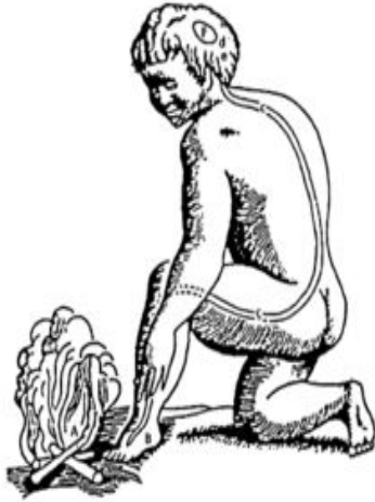
Illustration von Descartes:

Eine Reizung am Fuß wird über die Nerven ins Gehirn geleitet, interagiert dort mit dem Geist und erzeugt so ein Schmerzerleben. 185