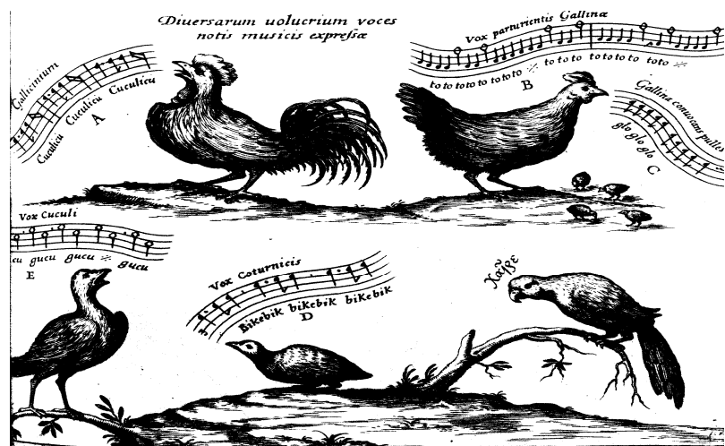
Iconismus III. fol. 30 aus: „Musurgia Universalis“

Neben der Analyse der Sprache (allgemeine Grammatik) - dieser ist kein geringes Ausmaß in „OD“ gewidmet - untersucht Foucault das Repräsentationsdenken in