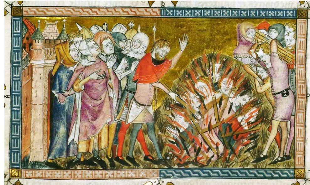
Masová scéna upalování Židů zaživa před městskými hradbami (miniatura Pierart dou Tielt), Antiquitates Flandriae oder Tractatus quartus , 1353