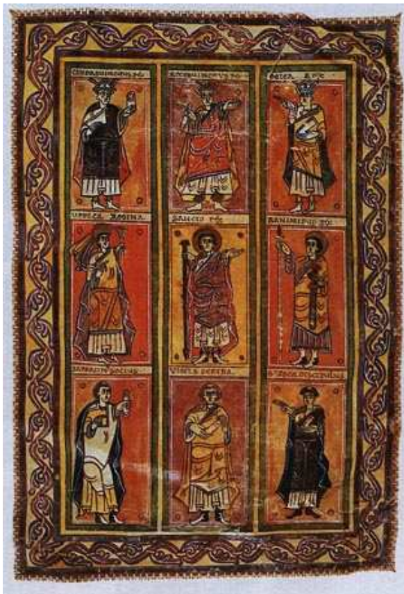
Vizigótské králové Iluminace, ca. 9. stol