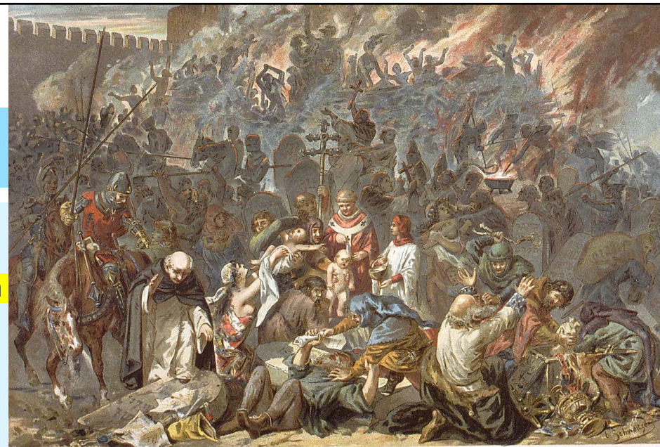
Smrt nebo křest - vyobrazení židovského pogromu, 19. století