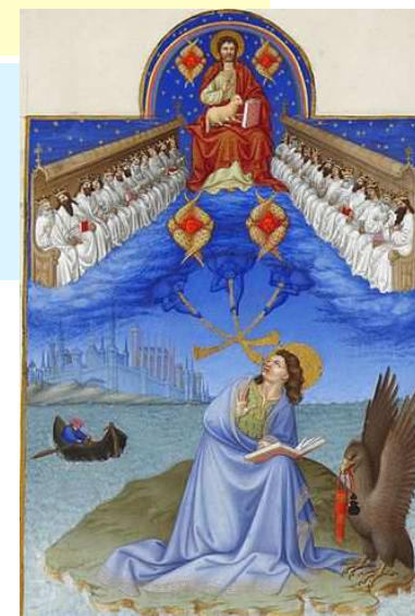
Vidění Janovo v Knize hodinek vévody z Berry (Francie, kolem 1430):

List církvi v Sardách: Hle, dávám do tvých rukou ty, kdo jsou ze synagogy satanovy; říkají si židé, a nejsou, ale lžou. Hle, způsobím, že přijdou a padnou ti k nohám; a poznají, že já jsem si tě zamiloval. (Zjevení Janovo 3,9, EKUM)