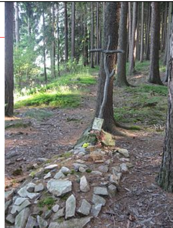
Symbolický hrob Anežky Hřůzové

Zeptejte se Sálusa, jak ji táhli do lesa. Sálus u ní vartu stál, když jí Hilsner podřezal.