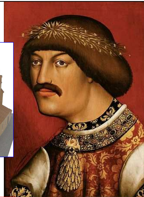
Rakouský vévoda Albrecht V. (III.) (Anonym, 16. století)