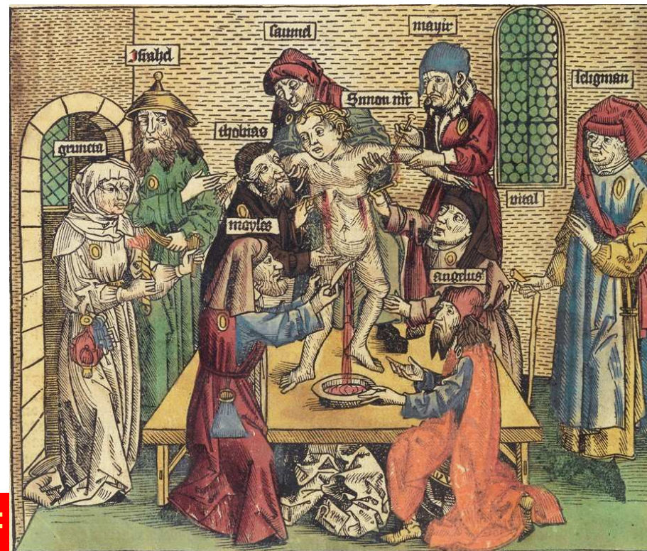
Mučednická smrt Šimona z Trenta (1475), Norimberská světová kronika, Hartmann Schedel (1493)