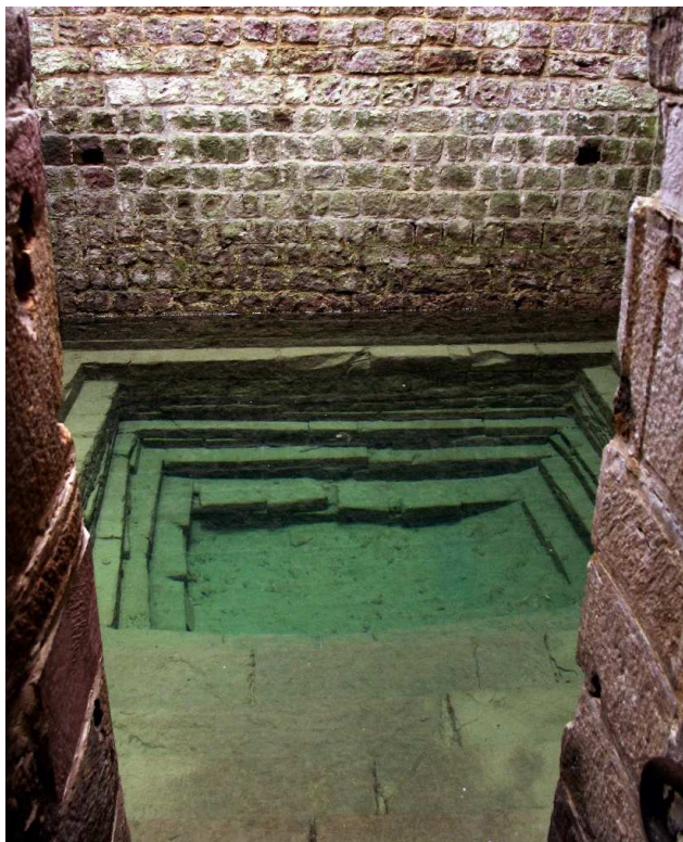
Židovské lázně (Mikwe) ve Spíru Ca. 10 – 12. stol.