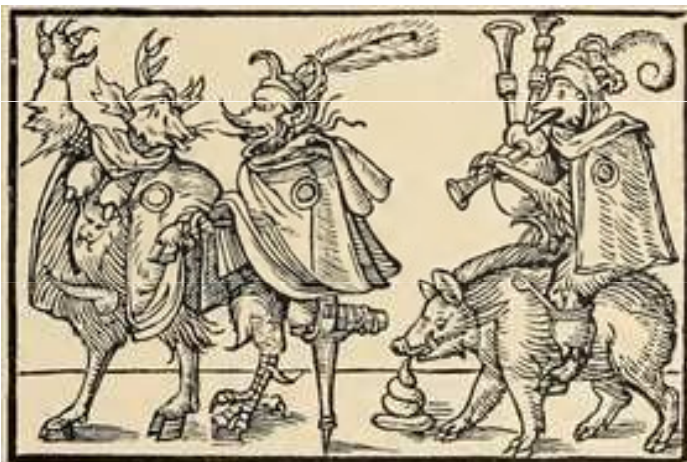
Der Juden Ehrbarkeit (1571)