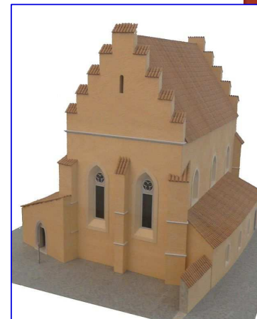
Miniaturní model gotické synagogy na vídeňském Judenplatzu