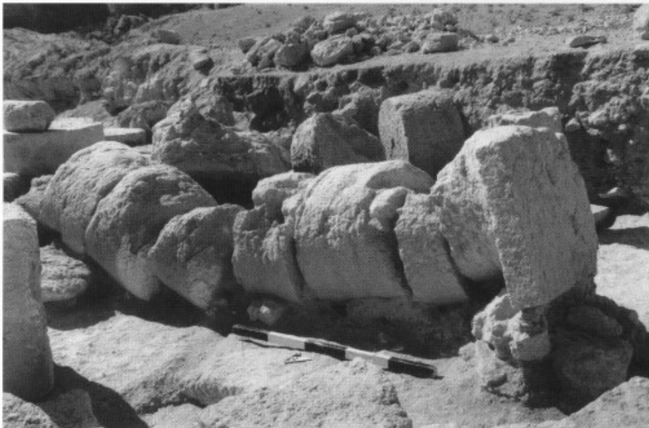
3. Fallen column, western façade of the temple.