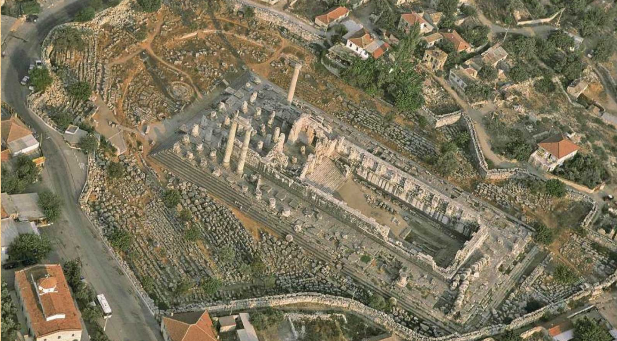
Chrám Apollóna v Didymě