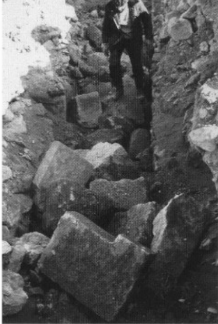
1. Jebel Khalid. Robbing of cella wall of temple, 1984.