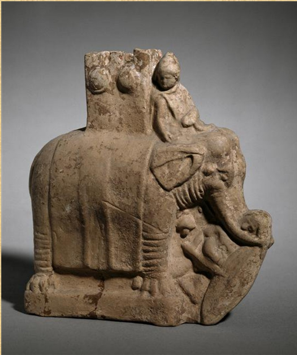
Soška válečného slona zadupávajícího galatského válečníka, 3. stol. Př. L.