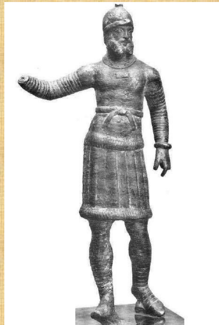
Soška seleukovského (parthského?) katafrakta