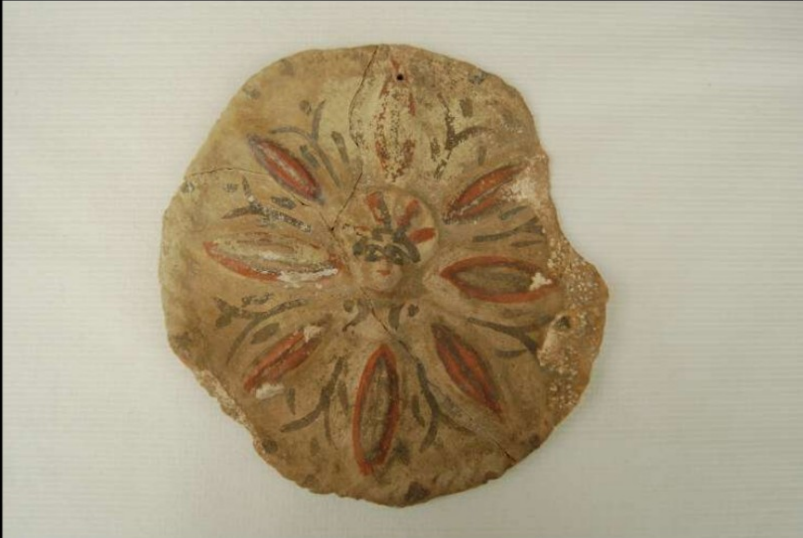
Hliněná ozdoba na zed', Babylon, Seleukovské období