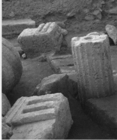
2. Metope and triglyph block, western façade of the temple.