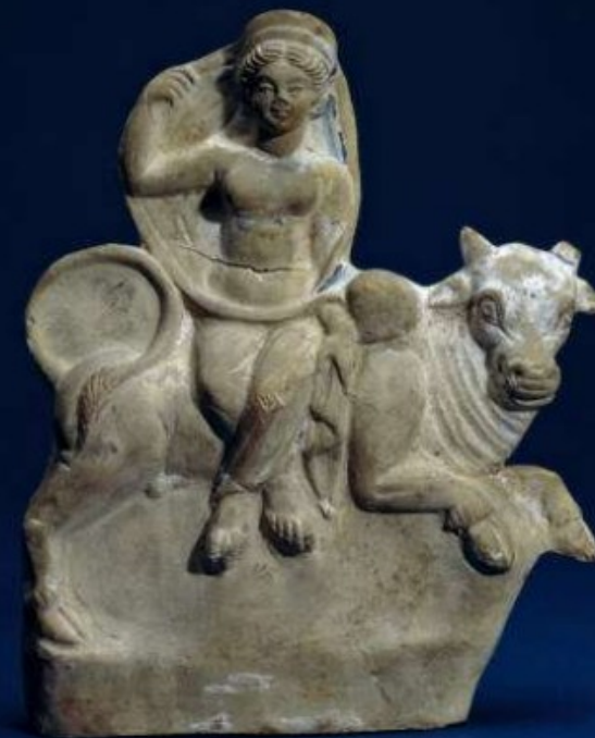
Soška Európy a Dia v býčí podobě, 3.-2. stol. Př. L.