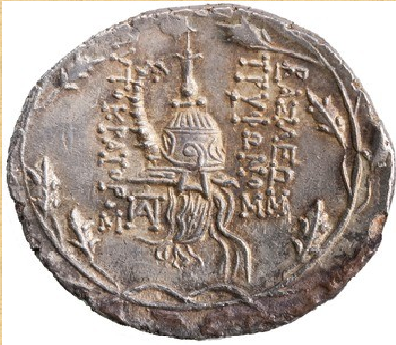
Mince uzurpátora Trýfóna, kolem poloviny 2. stol. Př. L.