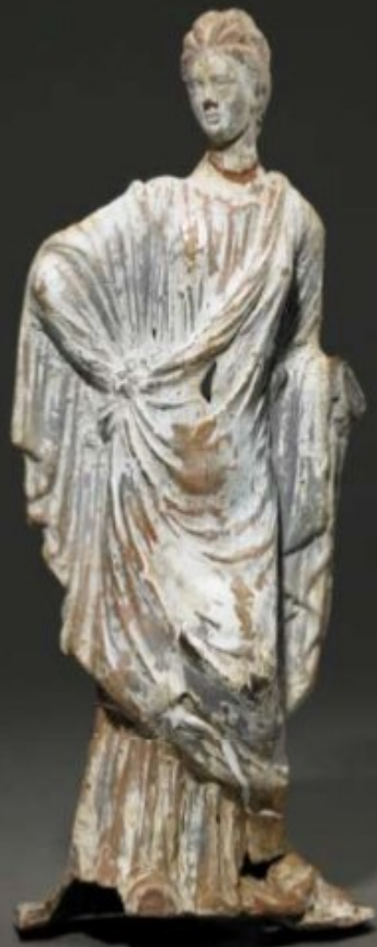
Soška ženy v řeckém oděvu, Babylón, 3. stol. Př. L.