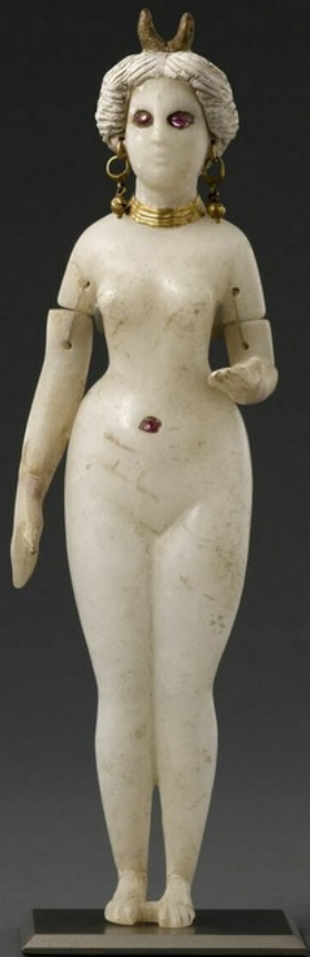
Soška bohyně (Nanaya? Innana?) z Babylónu, 3 stol. Př. L.