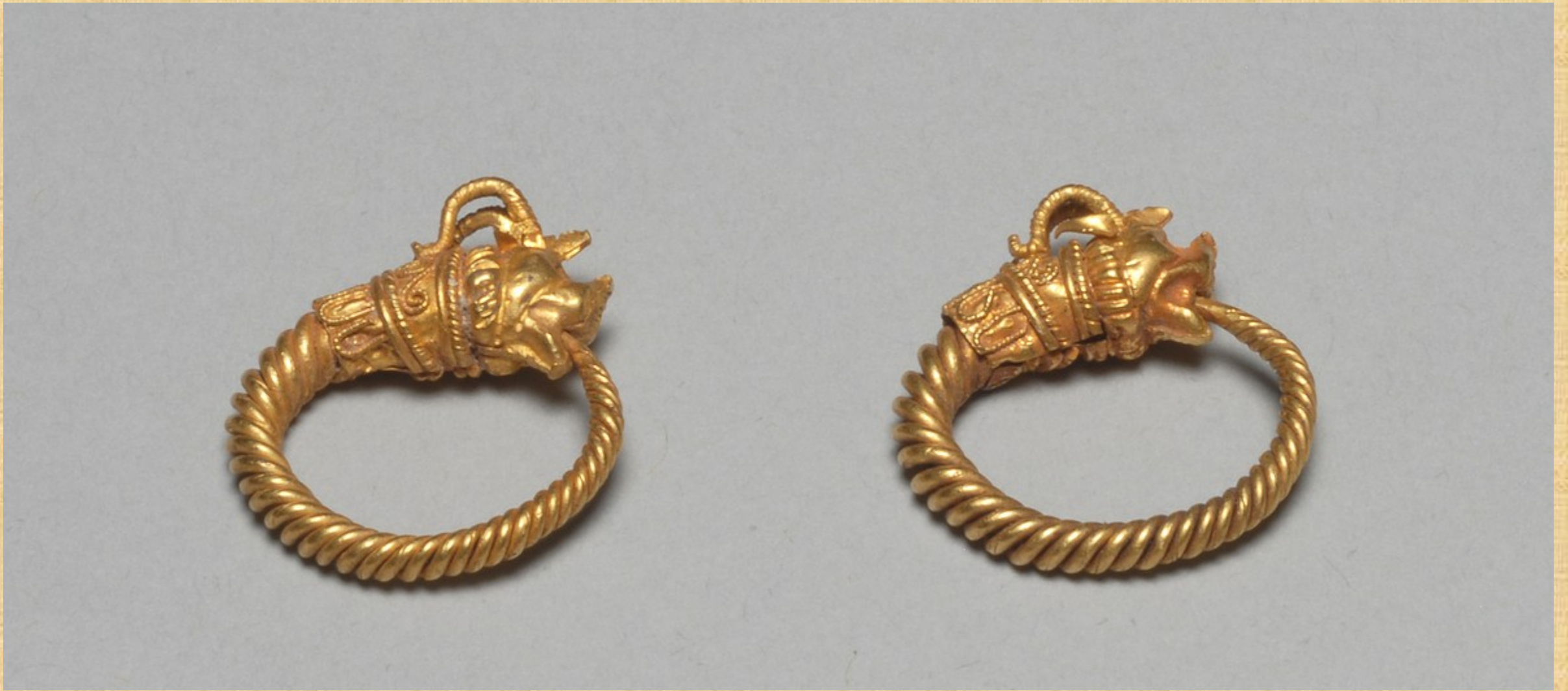
Zlaté náušnice, Antiochie, 4.-3. stol. Př. L.