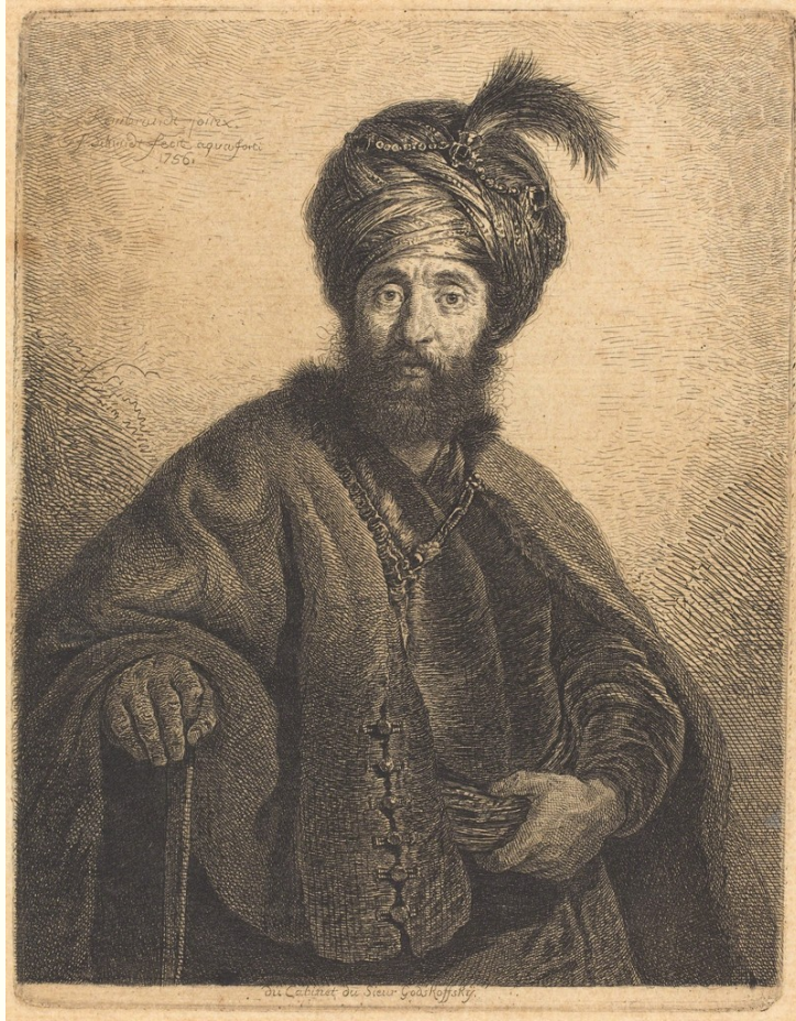
Georg Friedrich Schmidt podle Rembrandta Van Rijna, Peršan , 1756, National Gallery of Art, Washington