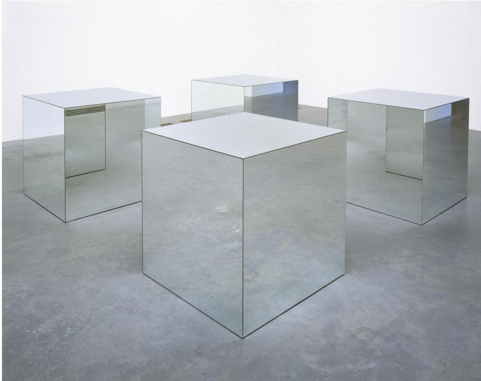
Robert Morris, Untitled , 1965, Tate Modern, London