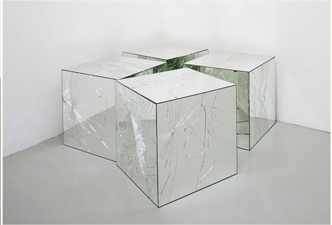
Jeppe Hein, Broken Mirror Cubes , 2005, Johann König Gallery, Berlin