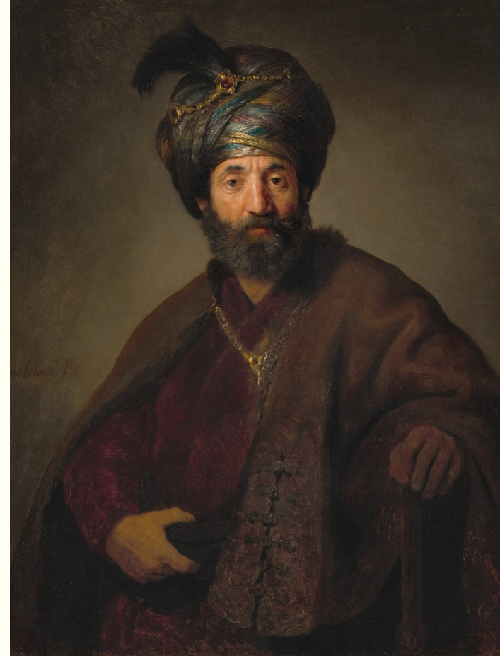
Rembrandt Van Rijn, Muž v orientálním kostýmu , 1635, National Gallery of Art, Washington