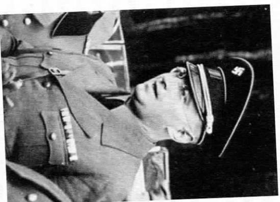
Konrad Henlein, vůdce většiny sudetských Němců od r. 1934

německých členů Hodžovy koalice, Franze Spiny a Erwina Zajicka. Jen o pár dnů později byl k odstoupení (i pro svůj židovský původ) přinucen i poslední německý ministr vlády Ludwig Czech, i když byla demise přijata až v dubnu a němečtí socialisté také jako jediná aktivističká strana do řad SDP nevstoupili. 511 Henlein, dirigující stále masovější stranu, jež nyní reprezentovala zhruba desetina českých Němců (potvrdily to koneckoně o pár týdnů později i výsledky obecních voleb), se pak v další taktice poháhal – nyní již definitivně – podřídit zájmům nacistické zahraniční po-