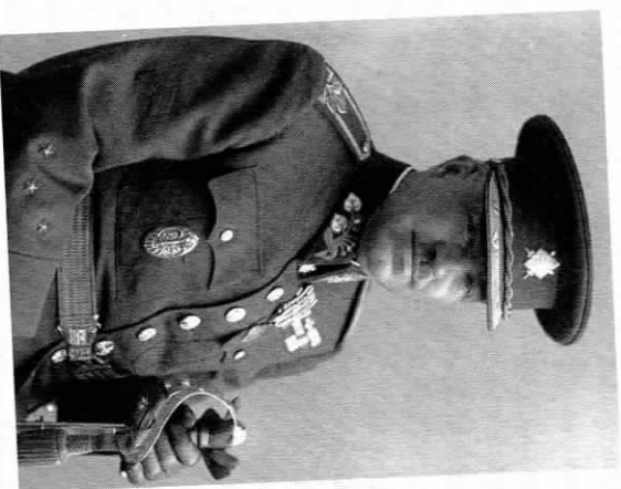
Generál Ludvík Krejčí, generalissimus československé armády v září 1938

Ani tyto nabídky, jdoucí na hranici zachování integrity státu, však neuspokojily pochopitelně ani henleinovce, ani Runcimana. Rozhovory či spíše Berlinem režirovaná fraška tedy pokračovaly. Zatímco pražským vládním kruhům nechyběly informace o německých přípravách k úderu, který byl oprávněně očekáván už koncem září, Chamberlainova vláda ještě před koncem srpna rozhodla, že pro Československo berlínem připadá do války nepůjde a v případě krize bude realizován plán Z, tj. přímé rozhovory premiéra s Hitlerem. Na Čechy pak měl být vyvíjen –