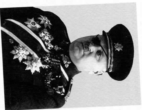
Generál Jan Surový, za světové války jeden z velitelů čs. legií v Rusku, od září do listopadu 1938 ministerský předseda ČSR

wehrmachtu proti republice, prezident a většina ministrů v čele s M. Hořzou rozhodli o přijetí návrhů. S tím se smířila i generálie, jejíž špičky si uvědomovaly bezvýhodnost případné izolované války (zatím nezmobilizované) republiky proti nacistické velmoci, do níž se ostatně evidentně chystaly zapojit i dva další sousedé ČSR. To se potvrdilo ostatně v nejbližších hodinách – Polsko ještě 21. září požadovalo odstoupení Těšínska, Maďarsko se – byť více diplomaticky – připojilo s vlastními nároky příštího dne. 542