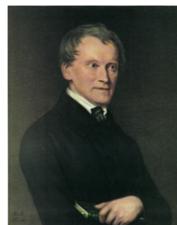
Johann Friedrich Böhmer (1795-1863)

Brněnské pobočka RI založená roku 2011 je nejmladším pracovištěm a zároveň první odnoží mimo Rakousko a Německo. Nachází se na Ústavu pomocných věd historických a archivnictví , ale oficiálně spadá pod Rakouskou akademii věd. Specializuje se na listiny císaře Zikmunda Lucemburského.