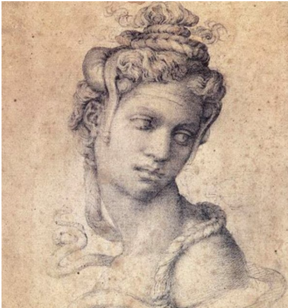
Kleopatra, Michelangelo, 1534 n.l.