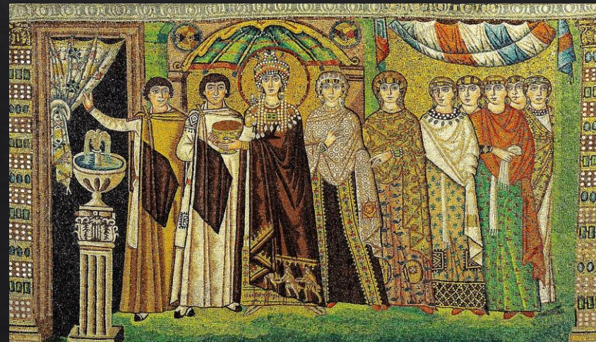
Bazilika San Vitale , Ravenna