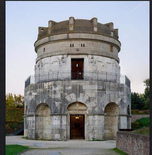
Ravenna: ariánská křtitelnice