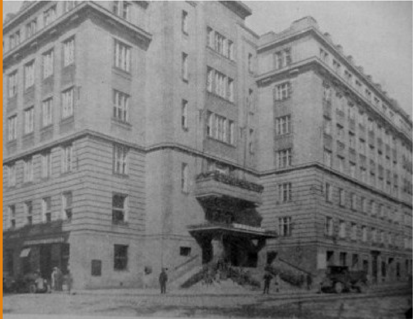
Nový Zemský dům v Brně.