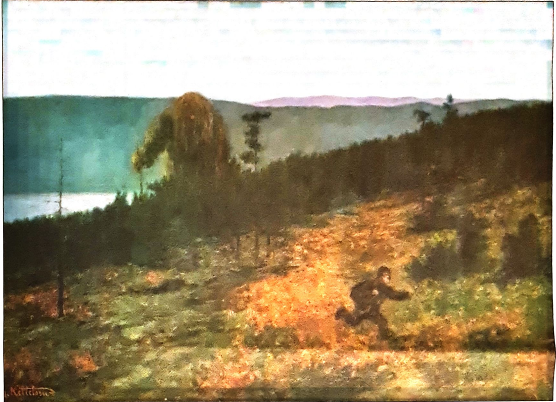
HEVN: I folkeeventyrene vokter trollet over skogen og hevner den som overskrider skogens grenser.

Det kommende valget burde vært et klimavalg, det største noensinne, men ingenting tyder på at det er sånn det blir. Klimakampen er i ferd