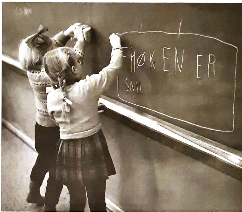
MØNSTERELEVER: Lærer barna egentlig mer på skolen enn før? Her fra Hauketo skole i 1959.

Andreas Outzen Spartacus 2023, 213 sider