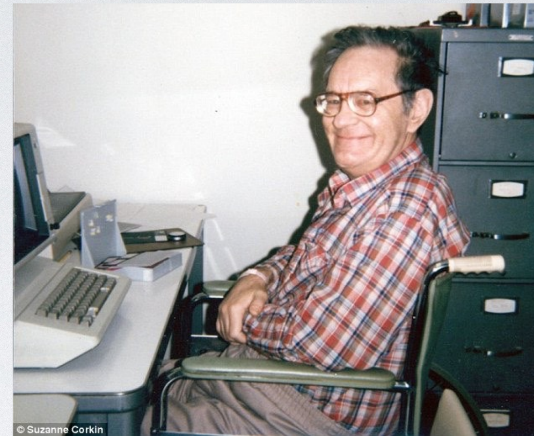
Henry Molaison (1926 - 2008)