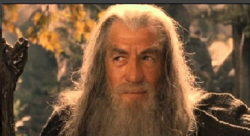
And my -er .