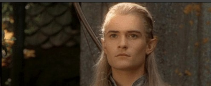
And my -a .