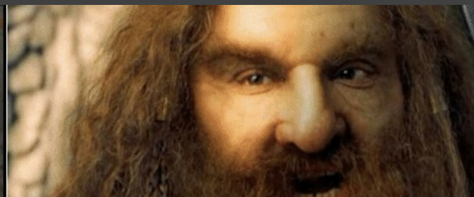
And my -um .