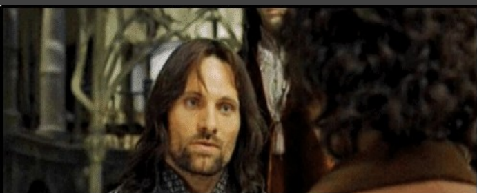
You have my -us .