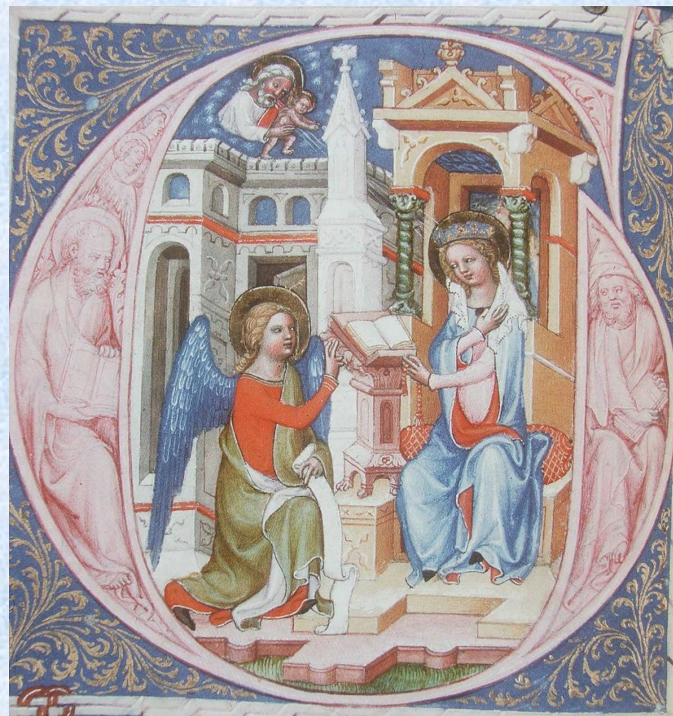
Liber viaticus Jana ze Středy, kol 1360