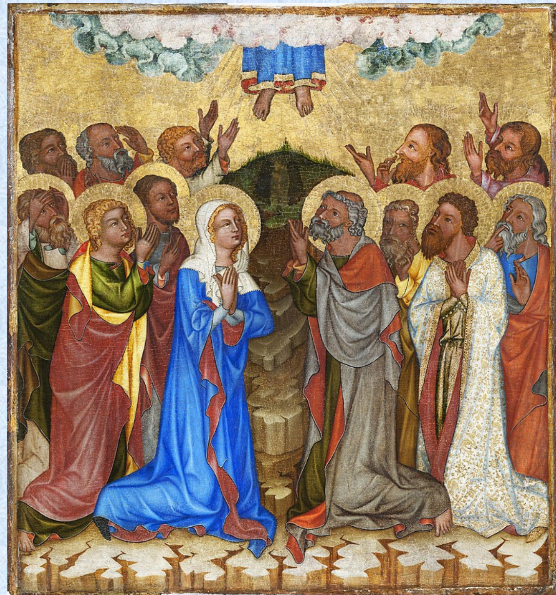
Mistr Vyšebrodského oltáře