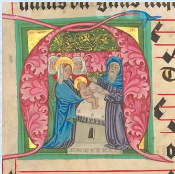
Kutnohorský graduál XXIII A, 38v