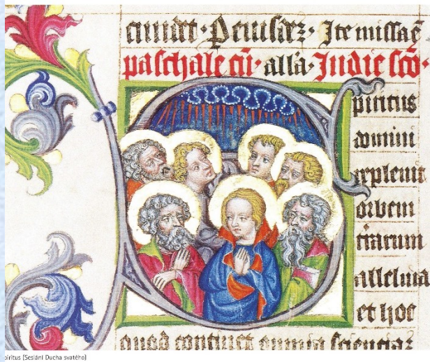
Brno, kol 1400, S