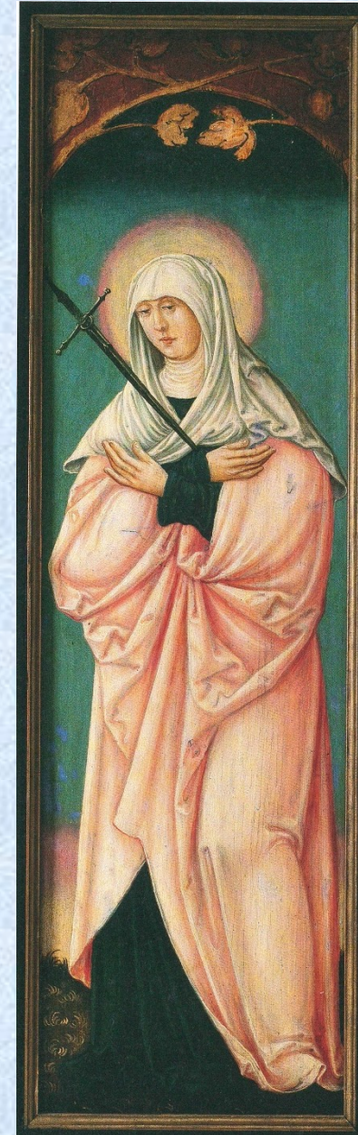
Panna Maria bolestná