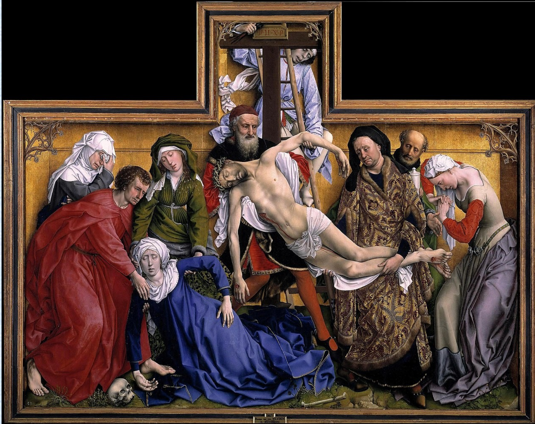
Rogier van der Weyden, 1435, Prado