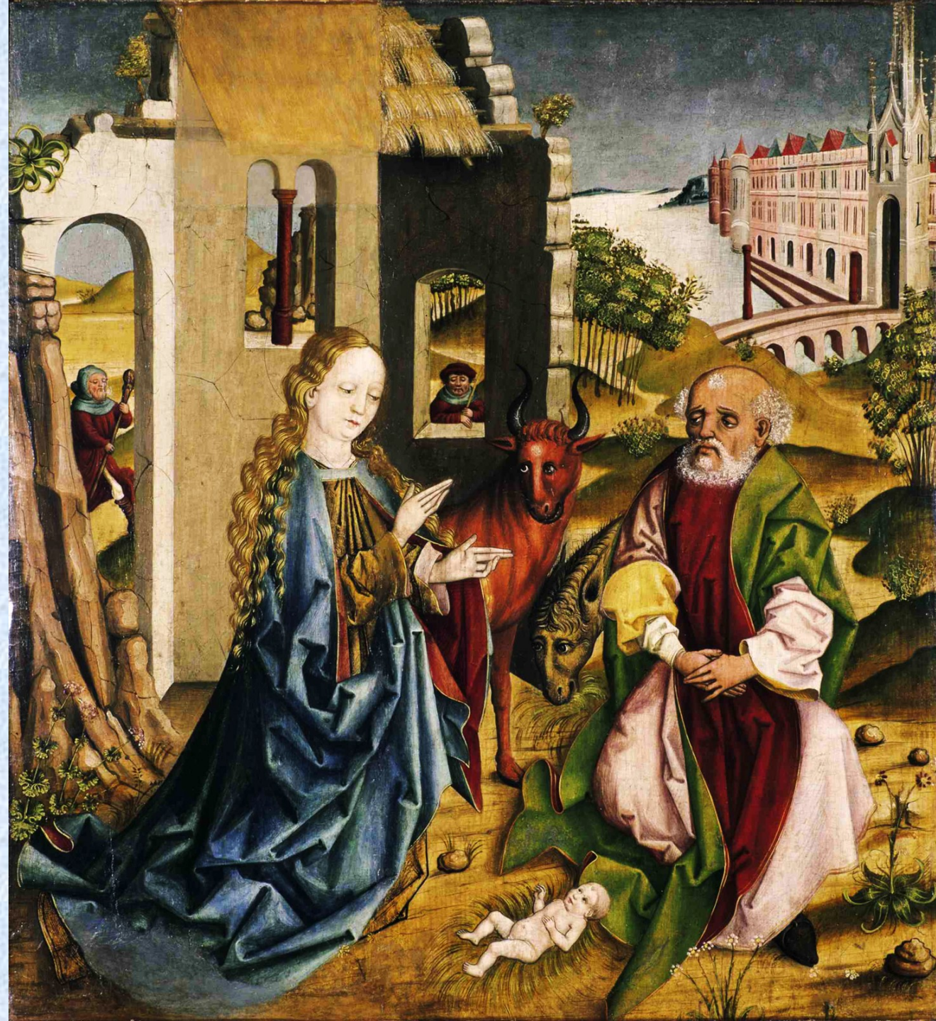
Archa z Doudleb, AJG