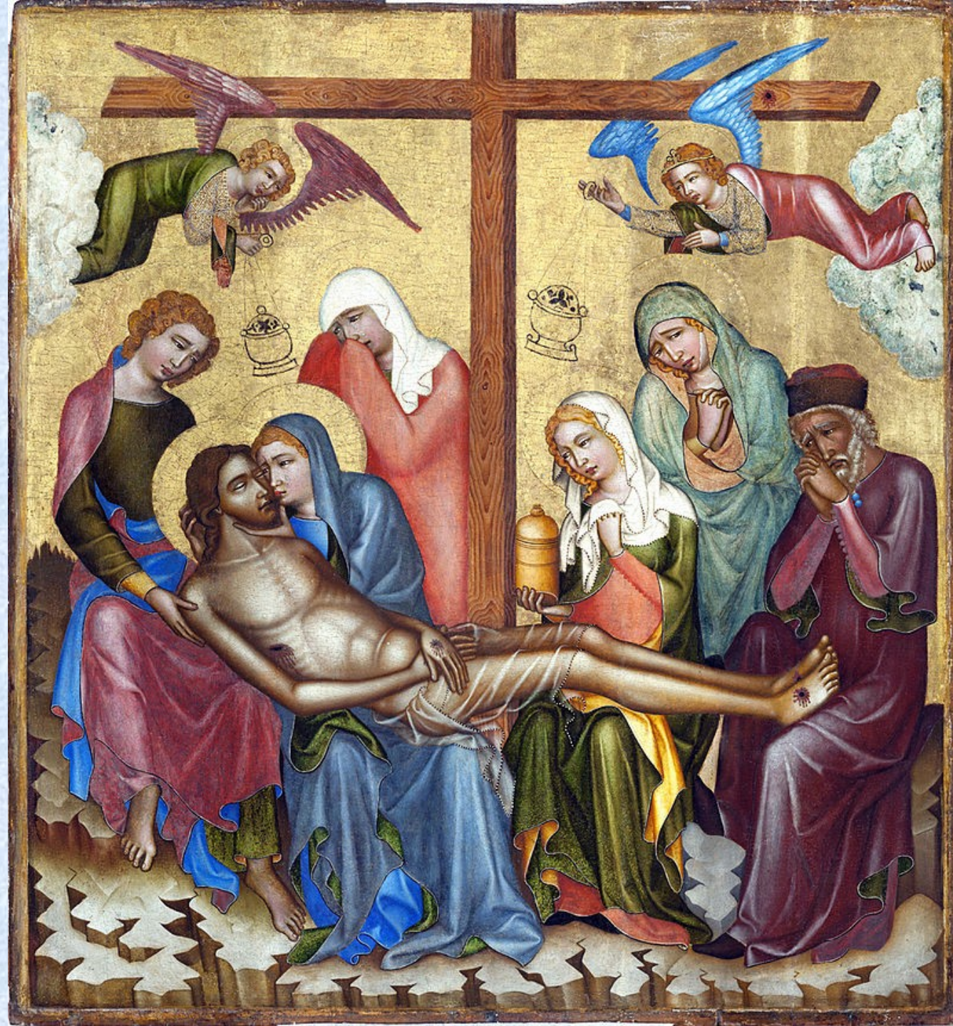
Mistr Vyšebrodského oltáře