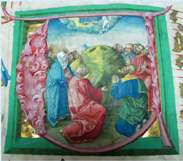
Louny IG 8