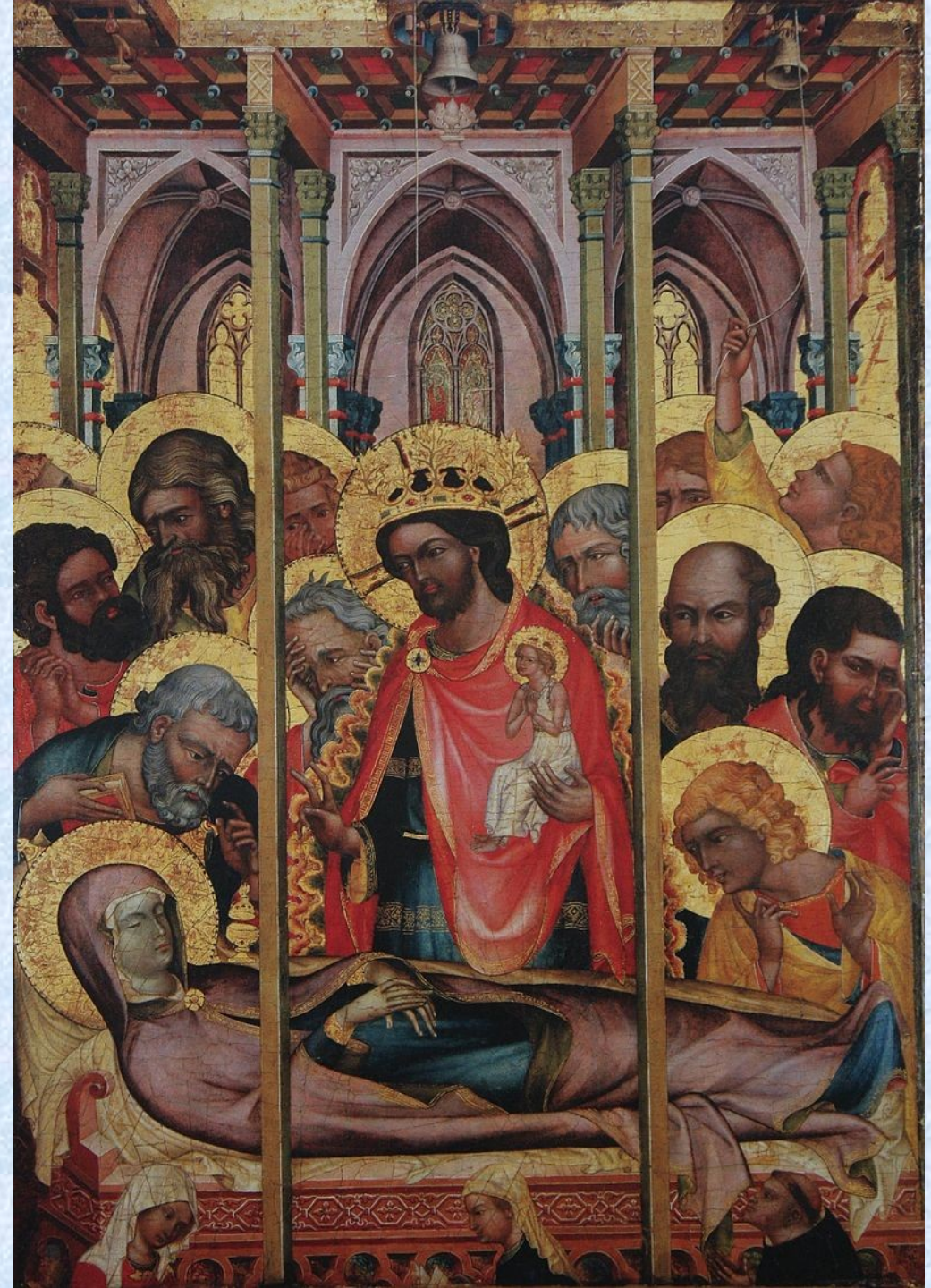
Smrt P. Marie z Košátek 1340- 1350