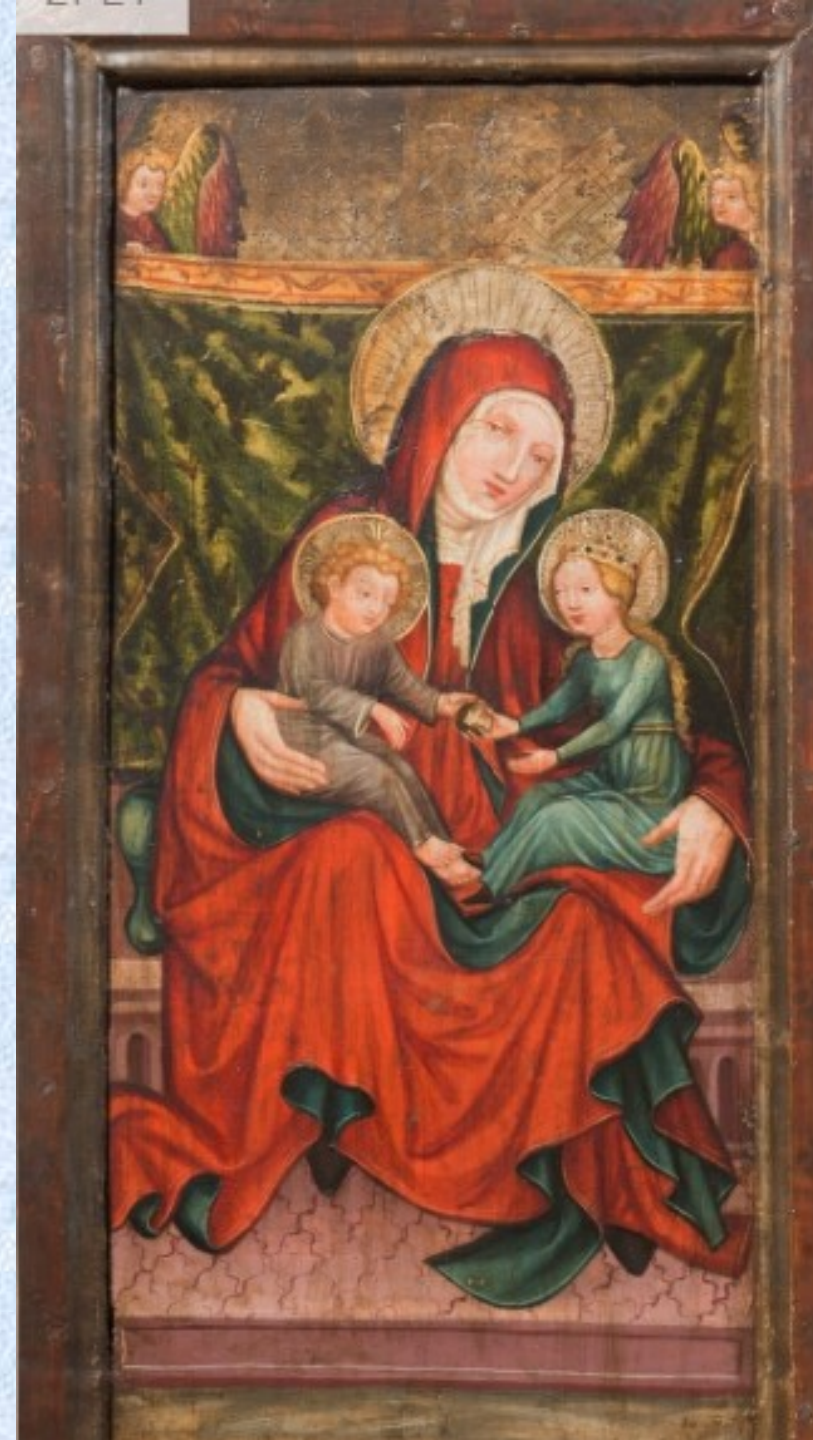
Reininghausův oltář, 1440