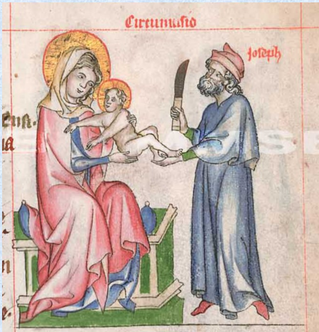
Pasionál abatyše Kunhuty, 1313 – 1321, NKČR, 6r