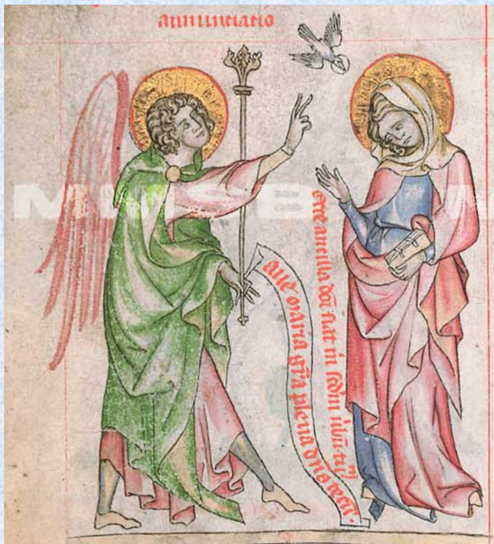
Pasionál abatyše Kunhuty, 1313 – 1321, NKČR, 5v