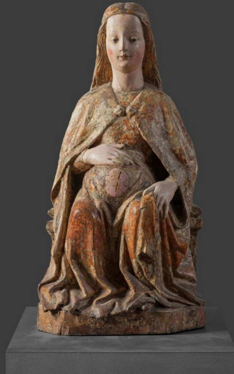
P. Marie v naději, Čechy, 1430, NG