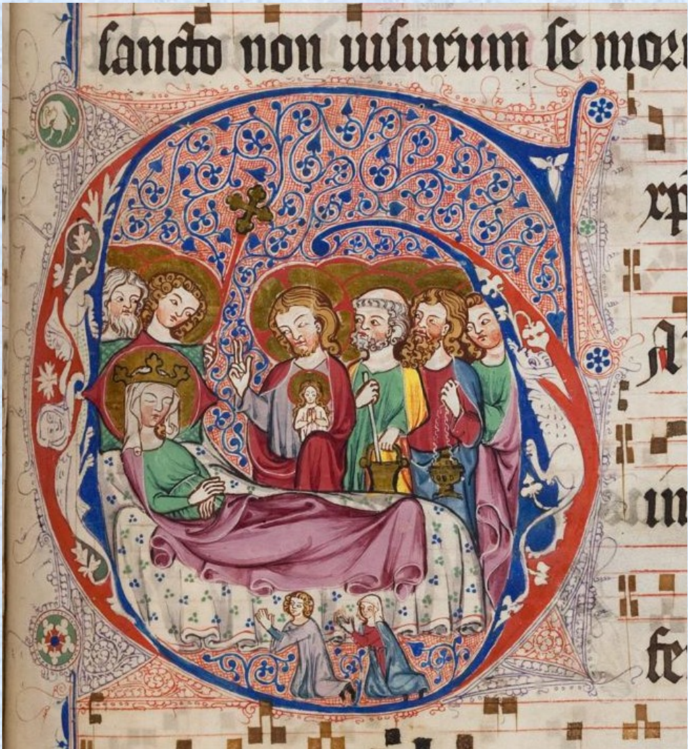
Iniciála D v graduálu cisterciaček Wonnental, Badische Landesbibliothek Karlsruhe, Po roce 1318