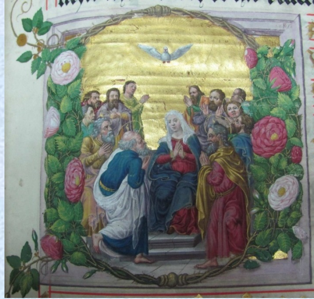
Louny IG 9