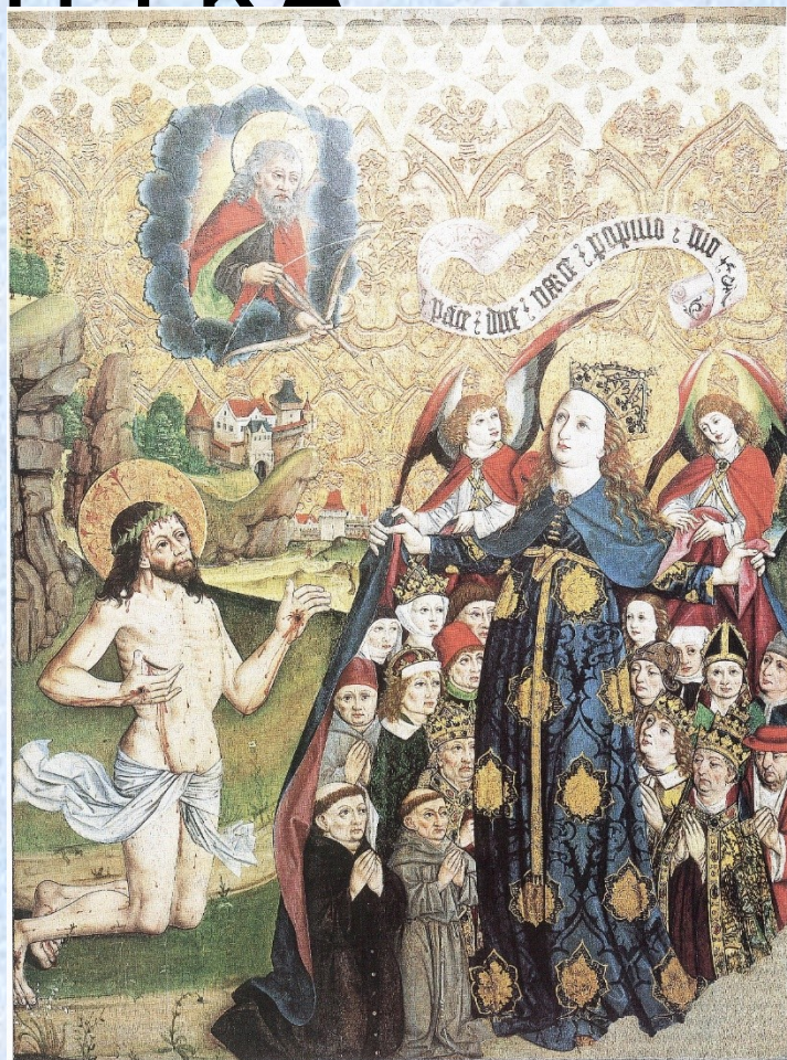
Z kláštera cisterciáček na St. Brně, kol 1480