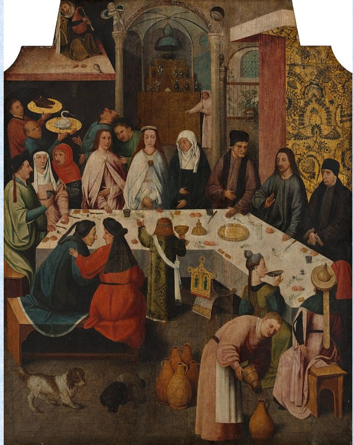
Hieronimus Bosch, 1475