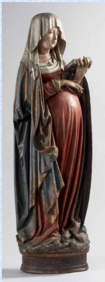
Maria in der Hoffnung, Schwaben, Anfang 16. Jh., Lindenholz gefasst Liebieghaus Skulpturensammlung, Frankfurt am Main