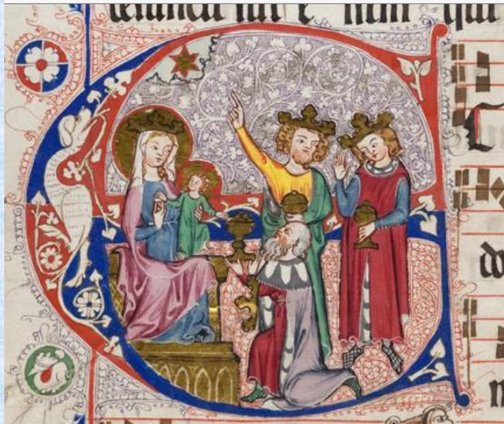
Iniciála D v graduálu cisterciaček Wonnental, Badische Landesbibliothek Karlsruhe, Po roce 1318