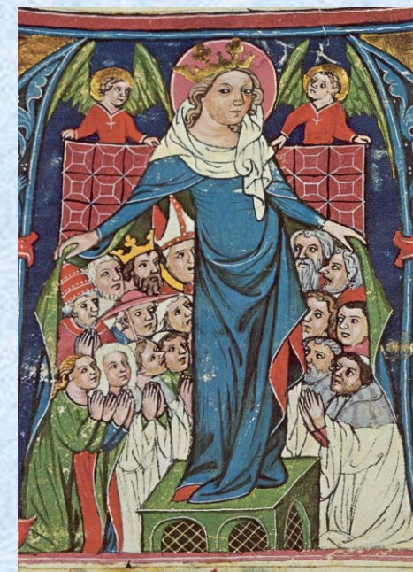
Ravensburger Schutzmantelmadonna (Michael Erhart)