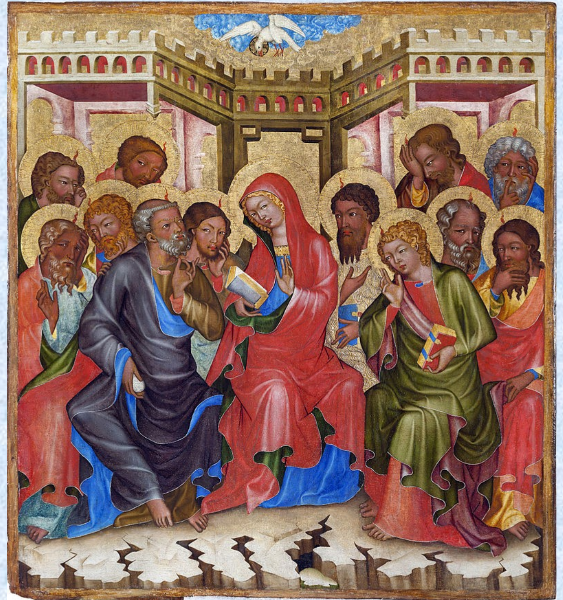
Mistr Vyšebrodského oltáře