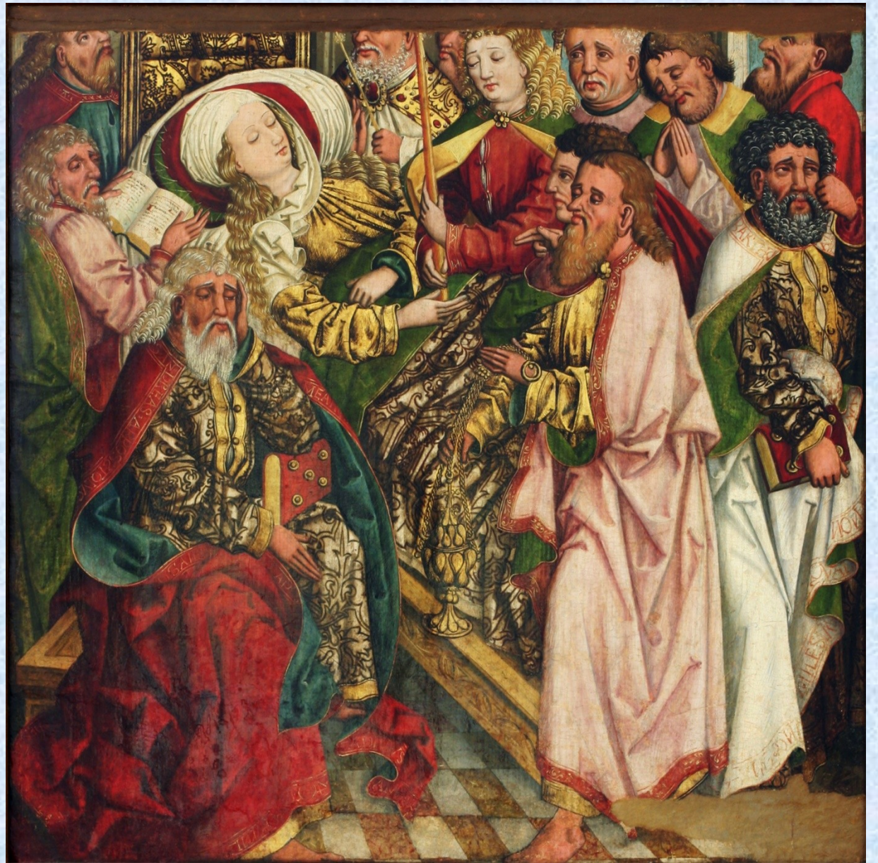
Archa z Doudleb