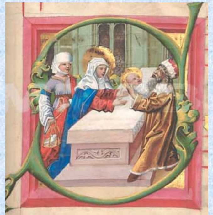
Lobkovický graduál, XXIII A 1, 1500-1510, f. 245