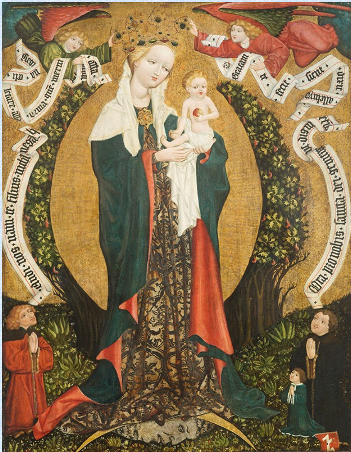
Assumpta z Deštné, kol 1450, NG