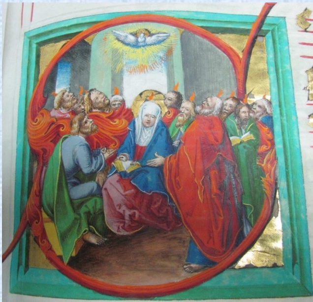
Louny IG 8