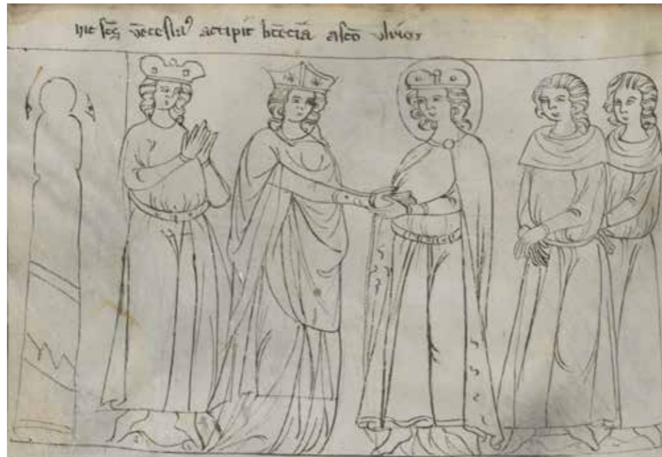
3. Domnělý řezenský biskup sv. Oldřich uděluje blíže nespecifikované povolení sv. Václavu. ( Liber depictus , Wien, ÖNB, Cod. 370, fol. 154v)

z mraku vystupuje žehnající Boží ruka. 35 Celá scéna se opakuje v následující kresbě, ve které probuzený nebožtik na márách již sedí, přičemž vyobrazení doplňuje popisek: A tak ho z půli vzkřísil svatý Oldřich a z půli svatý Václav. 36 Zázrak uzavírá poděkování vzkříšeného a jeho příbuzných. 37 Návštěva sv. Václava v Řezně u svatého Oldřicha poté pokračovala hostinou, 38 po níž podává sv. Oldřich za přítomnosti duchovních a družiníků knížeti ruku, čemuž byl připojen popisek Zde svatý Václav dostává povolení od svatého Oldřicha. 39 Jen v knize dříve zařazená svatováclavská legenda mohla čtenáři krumlovského kodexu osvětlit, že se za tímto blíže nespecifikovaným schválením skrýval Oldřichův souhlas s vysvěcením svatovítského kostela či respektive se zřízením pražského biskupství. Celou návštěvu českého panovníka uzavírá Václavův návrat domů. 40