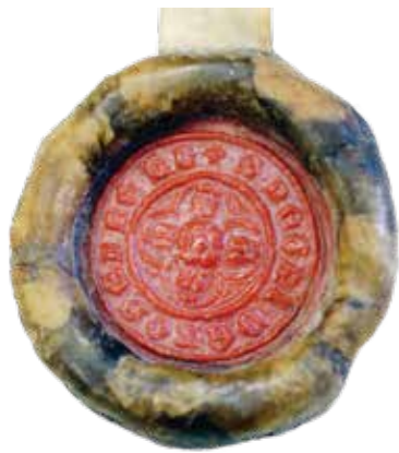
8. Druhý typ pečeti Petra II. z Rožmberka dochovaný na listině ze 4. října 1352. Rodový erb pětilisté růže je vsazen mezi čtyři soustředné po způsobu kříže umístěné litery „M“, nad nimiž se nachází koruna. (Státní oblastní archiv Třeboň, Velkostatek Třeboň, II. odd. I. A 3 K alfa, č. 125)

užíval od roku 1354 až do své smrti roku 1384, obklopuje rožmberskou růží pět písmen M. Všechny litery jsou tentokrát bez korun a jsou vsazeny do pěti listů, čímž zde podruhé vzniká obrys pětilisté rožmberské růže. V pečetním opisu, kde čteme S. PETRI DE ROSENBERK, je mezi jednotlivá slova vsazena pětilistá růže a na závěr opět minuskulní litera M. 77 Souběžně s těmito pečeti užíval Rožmberk duchovního stavu ještě další typář, jehož nejstarší otisk se dochoval na listině z roku 1347. Tato pečeť již sice není heraldická, ale v symbolické rovině vyjadřuje totéž co zbývající dva typáře. Uprostřed pole stojí mezi dvěma štíty s rožmberskými růžemi světice s knihou – zjevně Panna Marie, která klade svou ochrannou či žehnající ruku na jeden z rodových erbů. 78 Jak upozornil Daniel Soukup, Petrova demonstrativní sebezprezentace v podobě zasvěcení Bohorodičce může pramenit i z faktu, že v této době byl ve svatovítské kapitule oživen mariánský kult. Roku 1343 zakládá markrabě Karel při pražském kostele sbor mansionářů, jejichž úkolem bylo denně zpívat při mši sloužené k počtě Panny Marie. Petrova pečeť přímo nabízí i otázku, zda mladý Rožmberk k této rodící se nové komunitě biskupského chrámu i určitým způsobem nenáležel. 79