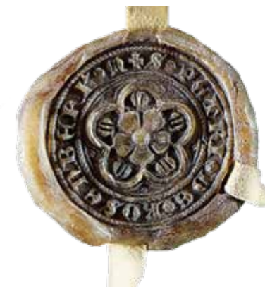
9. Třetí typ pečeti Petra II. z Rožmberka dochovaný na listině ze 17. prosince 1355. Rožmberskou růží obklopuje pět mariánských monogramů „M“. Tato litera a růže se rovněž objevují v opisu pečeti. (Státní oblastní archiv Třeboň, Cizí rody, kart. 68, inv. č. 12)

Na Petra II. z Rožmberka jako na prvního čtenáře kodexu Liber depictus a jeho následného dárce františkánům v Krumlově poukazuje i fakt, že právě on byl jejich nejvýznamnějším podporovatelem a „fundátorem“. Zejména byl svého času nejtědřejším donátorem knih, a to nejen tohoto jihočeského konventu. Pokud předložené úvahy směřují správným směrem, nelze opominout ještě jednu zajímavou souvislost. Petr II. z Rožmberka nebyl tehdy jediným pražským kanovníkem, který se mohl chlubit takovouto obrazovou knihou. Nezapomínejme, že nedlouho předtím si jiný pražský kanovník jménem Velislav nechal vyhotovit podobný obrazový kodex plný biblických příběhů a legend, který je znám pod názvem Biblia picta Velislai . 83