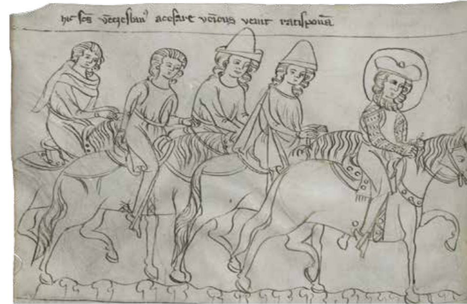
2. Sv. Václav jede se svou družinou do Řezna k domnělému tamnímu biskupu sv. Oldřichovi. ( Liber depictus, Wien, ÖNB, Cod. 370, fol. 152r)

V Čechách 14. století bylo samozřejmě notoricky známo, že pražské biskupství bylo zřízeno až mnohem později (konkrétně v letech 968–973) a jeho počátky jsou zejména spojeny se svatým Vojtěchem. Ani tehdejší kronikáři, tzv. Dalimil či letopisci doby Karla IV., kteří se neostýchali leccos přidat, zcela respektovali fakt, že se pražská diecéze zrodila až notnou řádku desetiletí po Václavově smrti. A to ani nevyjímaje s českými reáliemi ne zcela obeznámeného Jana Marignolu. Koneckonců tyto základní kameny povědomí o církevním