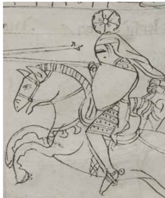
7. Na stránkách krumlovského kodexu byl svatě Alžbětě přisouzen erb mariánského monogramu s korunkou, zatímco jejímu choti durynskému lankraběti Ludvíkovi znak pětilisté růže. ( Liber depictus , Wien, ÖNB, Cod. 370, ff. 92v–93r)