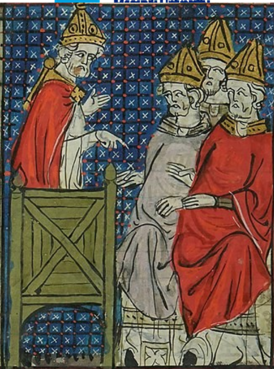
Urban v Clermontu (Grandes Chroniques de France, 14. stol)