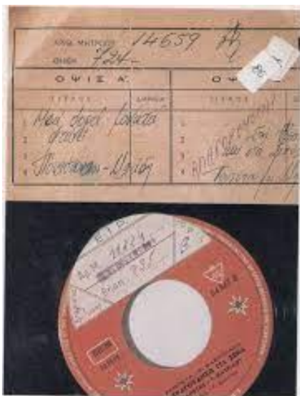
Επάνω: το... έγκριο αναγράφει Κάτω: δίσκοι του Γιώργου Σεργίου που διαγράφηκε και αυτό, προφανώς αντιταξιακά