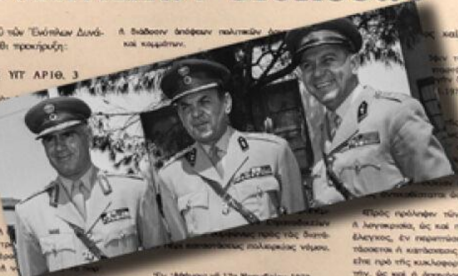
Ἐν Ἀθήναις τῆ 17ῃ Νοεμβρίου 1973 Ὁ Ἀρχηγός Ἐνόμων Δυνάμεων ΔΗΜΗΤΡΙΟΣ ΖΑΓΟΡΙΑΝΑΚΟΣ Στρατηγός

Ἐπὶ τὴν πρόληψιν τῶν ἀνωτέρω ἐπιπέσεων Ἀ λογοκρισία, ὡς καὶ παντός εἴδους σκεταδο ἔλεγχος, ἐν περιπτώσει δε παραβουλεύσεως δια τάξεως ἢ κωλύσεως τῶν ἐντολῶν ἐν γένει εἴη πρό τῆς κυλιόμενης αὐτῶν, εἴτε μετ' αὐ τῶν, ὡς καὶ ἡ ἀπαγόρευσις τῆς παραστάσεως ἢ προβαλὴς τῶν ἐργασιῶν.