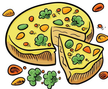
quiche lorraine (f)