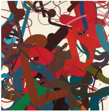
Zdeněk Sýkora: Linie č. 31, 1985, olej na plátně, 200 x 200 cm, odhad: 180 000 – 220 000 eur, prodáno za 860 000 eur (s poplatky přes 1 mil. eur) Galerie Lempertz, Kolín nad Rýnem 17. 6. 2021