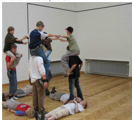
Galerijní animace (W.Lehmbruck) Galerijní animace (D.Chatrný)