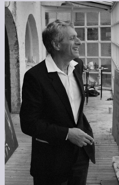
Iannis Xenakis