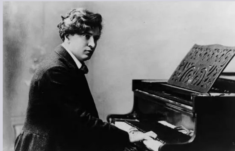
Ferruccio Busoni