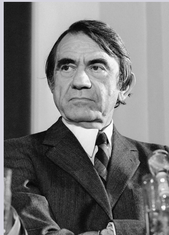
Pierre Schaeffer