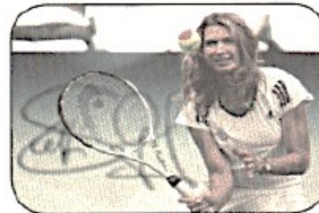
Це дівчина. Вона спортсменка.