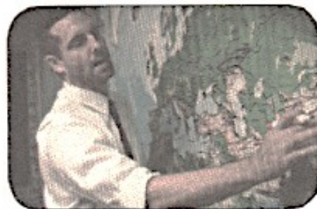
Це викладач. Він українець.