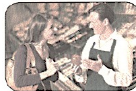
Це хлопець і дівчина. Він продавець. Вона покупець.