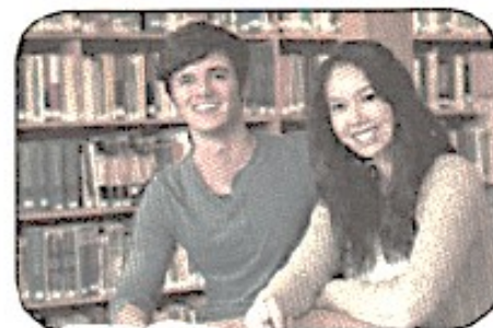
Це хлопець і дівчина. Він студент. Вона студентка.