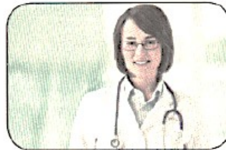
Це жінка. Вона лікар.