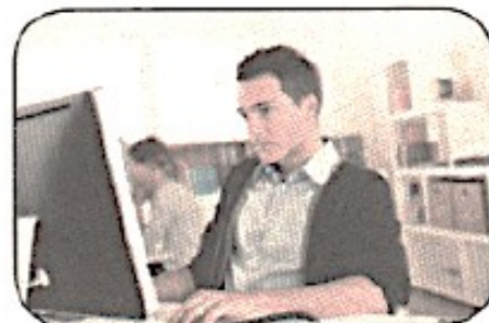
Це чоловік. Він програміст.