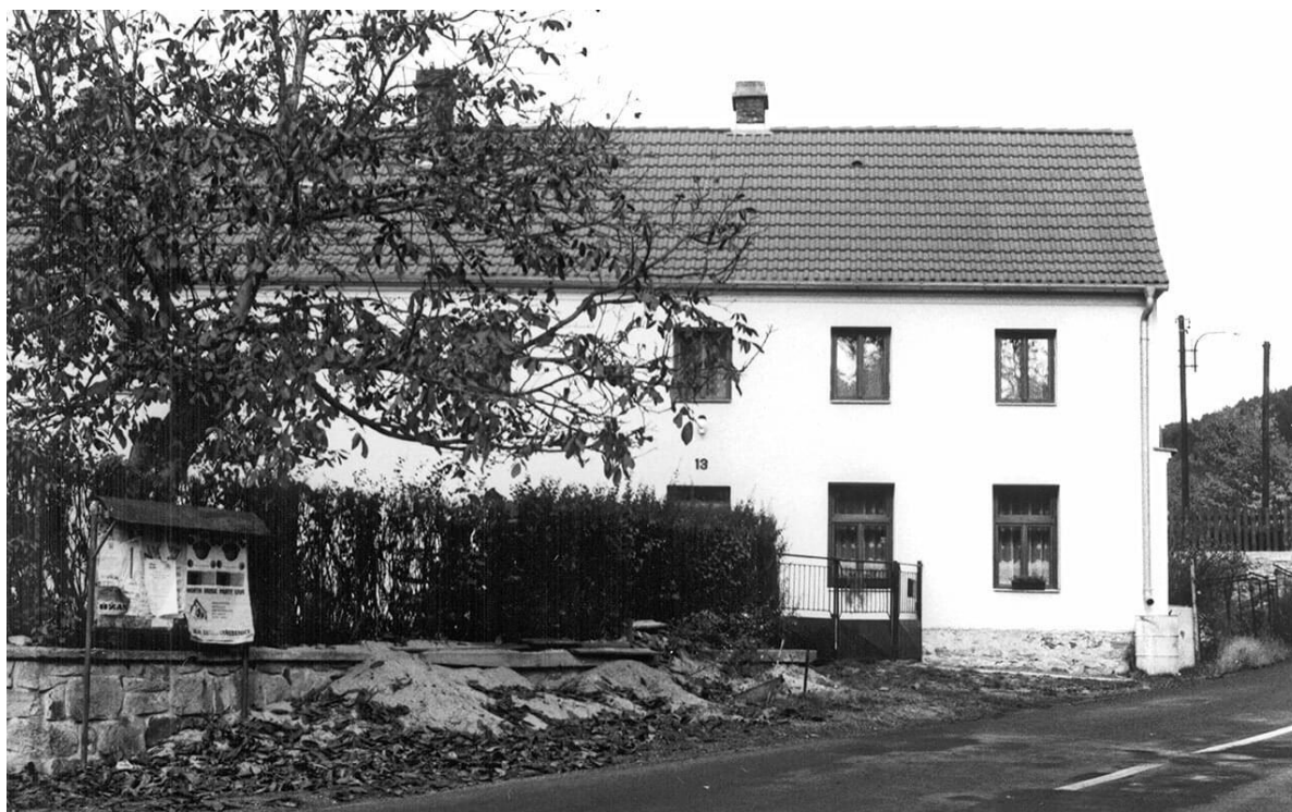
Horní Vysoké 2004, zdroj Antikomplex, z. s.

Jak a proč se změnila podoba obce Horní Vysoké, odkud byli vysídleni čeští Němci?