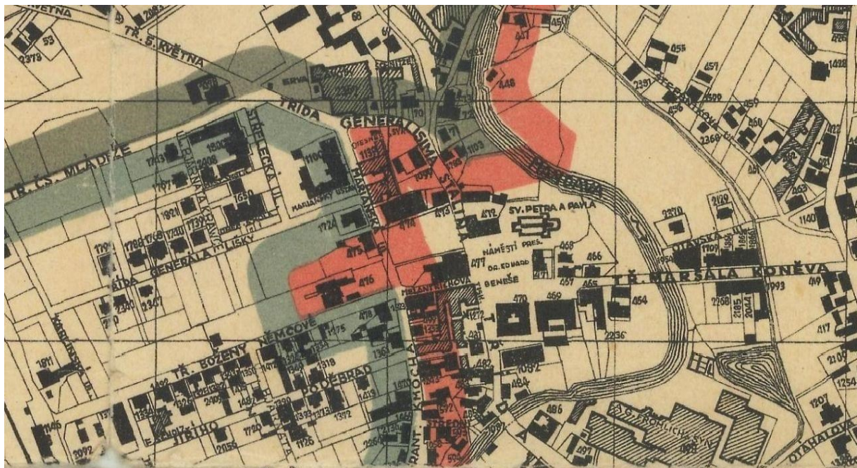
Orientační plán města Varnsdorfu, zhotoven městským stavebním úřadem roku 1945, zdroj Muzeum Varnsdorf

Prostudujte tabulku s počty obyvatel Varnsdorfu