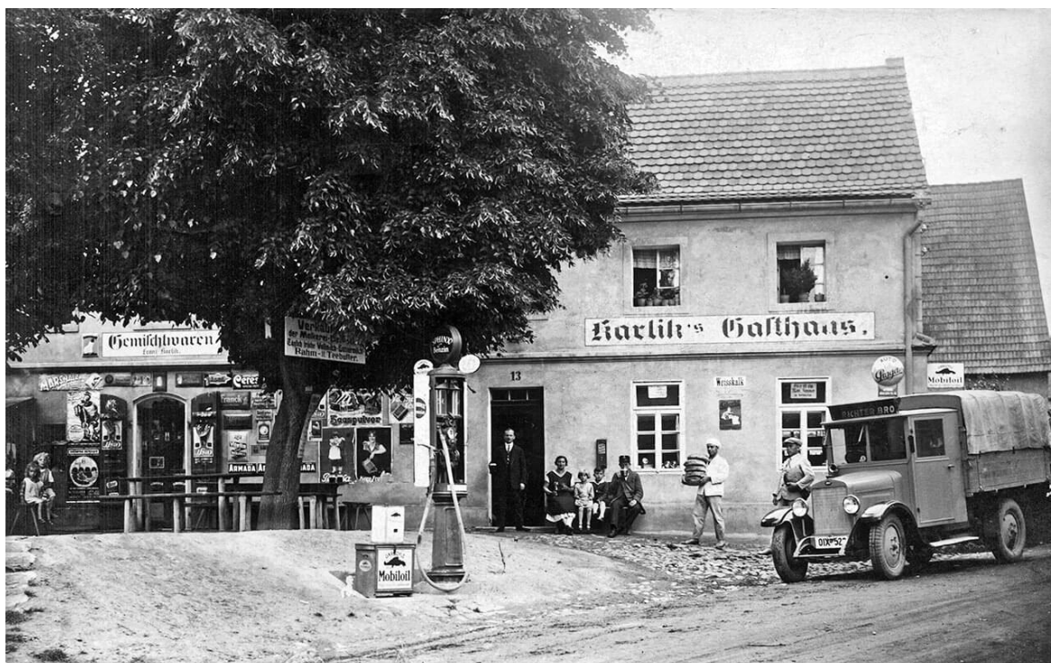
Horní Vysoké (Ober-Weissig) 1925

A) Prohlédněte si fotografie stejného místa. Označte, co se změnilo a co zůstalo stejné.