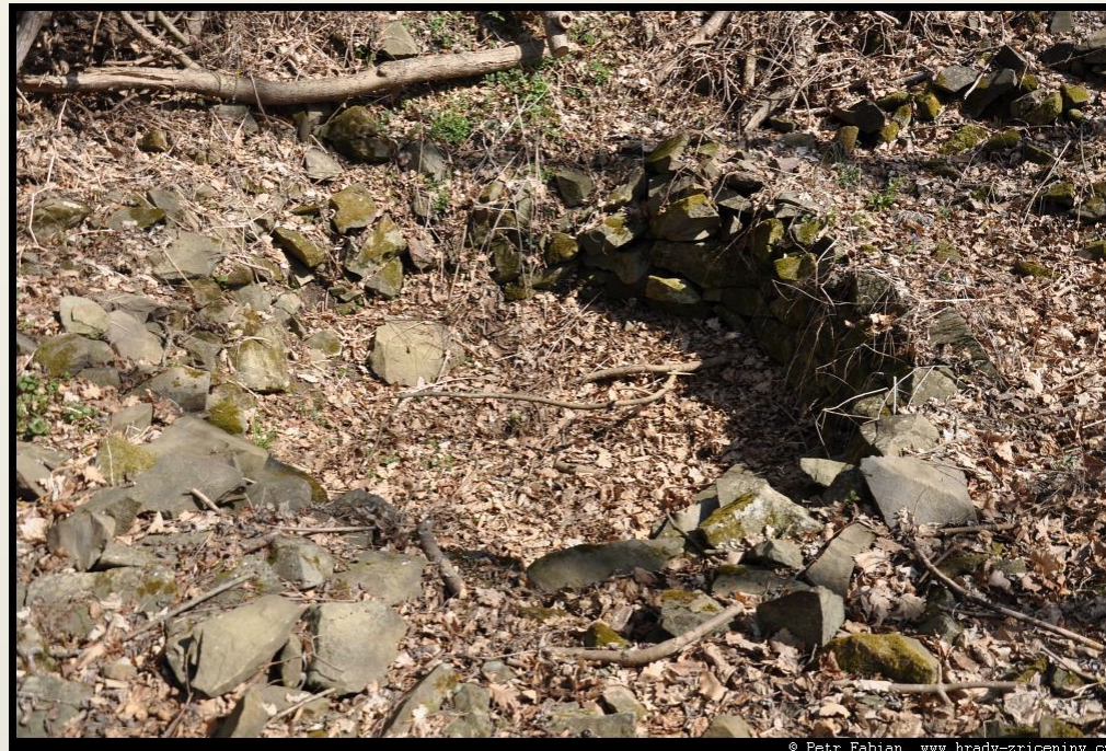
Obr.2: Pozůstatky cisterny