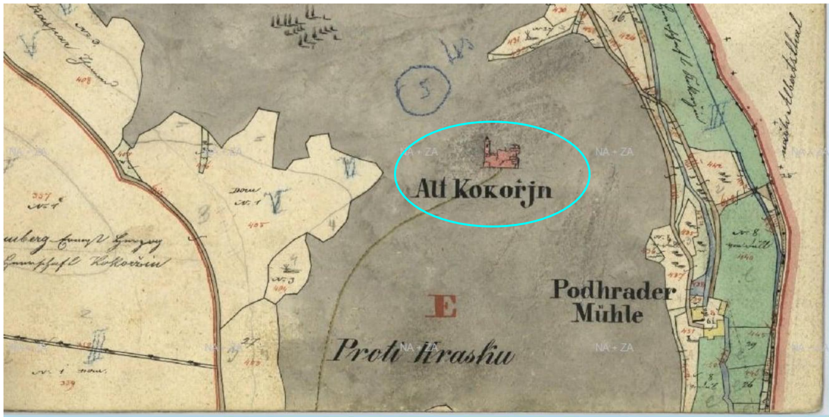
Indikační skica (3271-1) z roku 1842 katastru Kokořín - Kokorzin. Hrad Kokořín vyznačen v modré elipse.