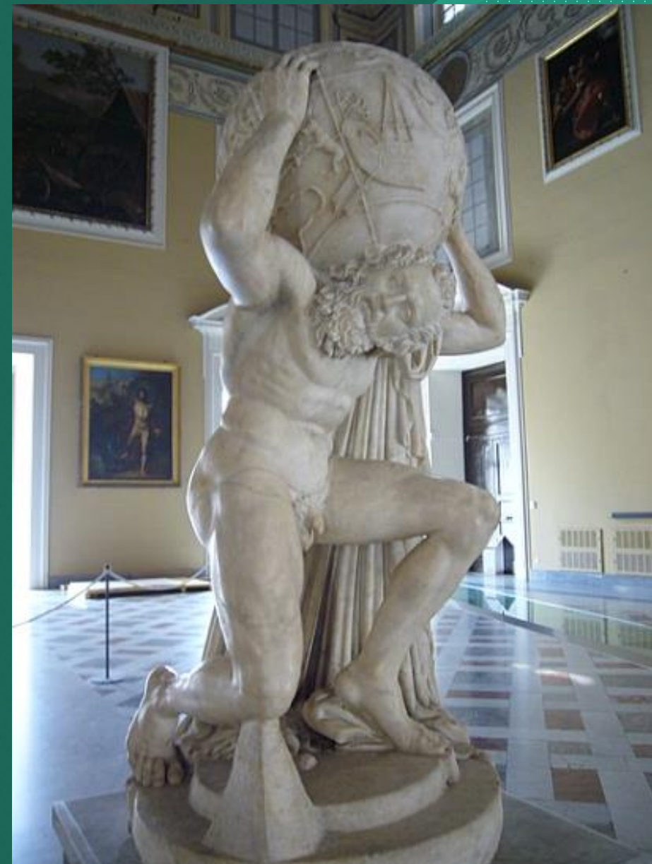
Neapolské muzeum – socha Atlanta