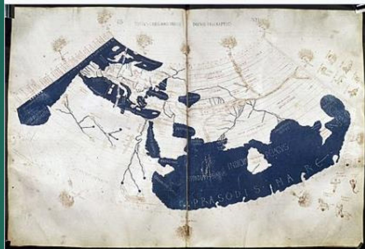
Ptolemaiova mapa světa, 150 (Geographia)