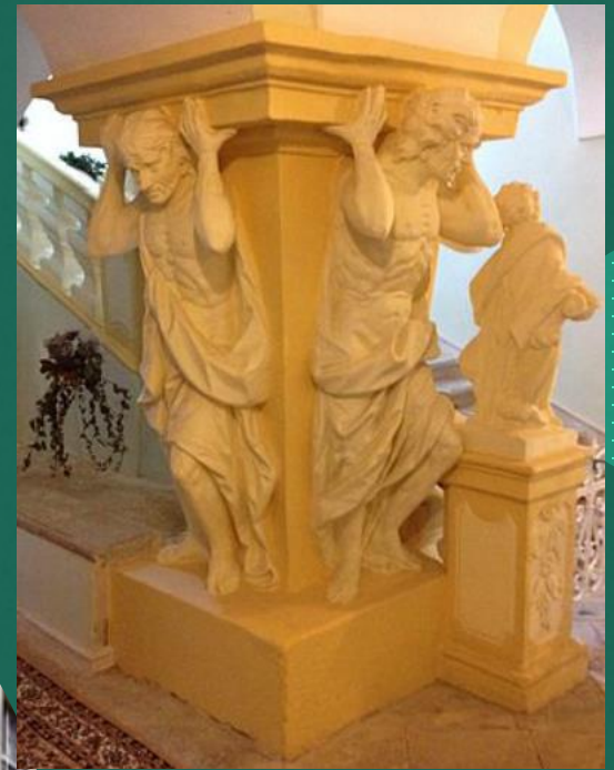
Obrázek vpravo: Atlantové na zámku Nové Hrady