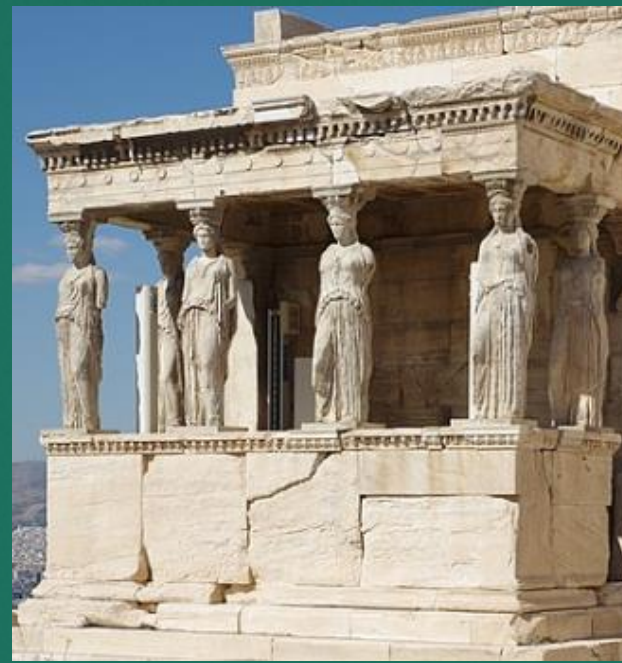
Erechtheion v Athénách