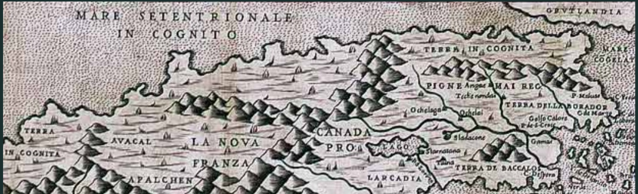
Mapa severní Ameriky z roku 1566