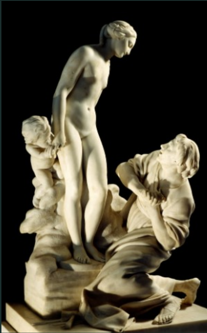
Pygmalion (a Galatea)