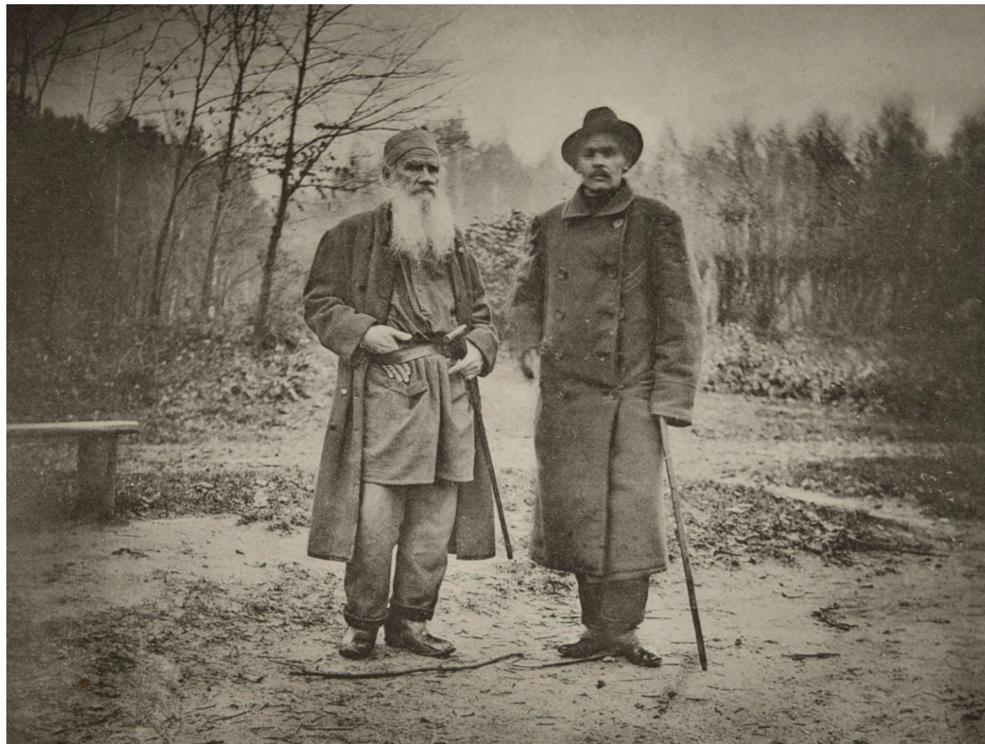
M. Gorkij s L. N. Tolstým v Jasně Poljaně – 1900