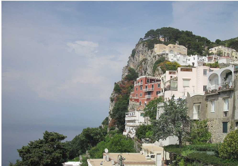
Vila Spinola (dnes Behring) na Capri