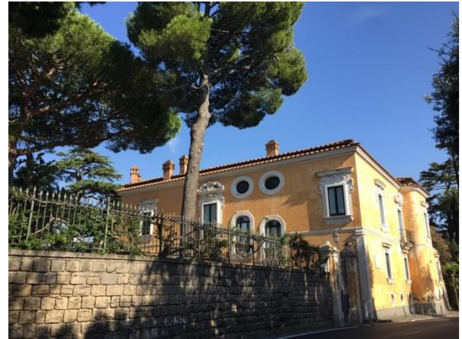
Vila v Sorrentu