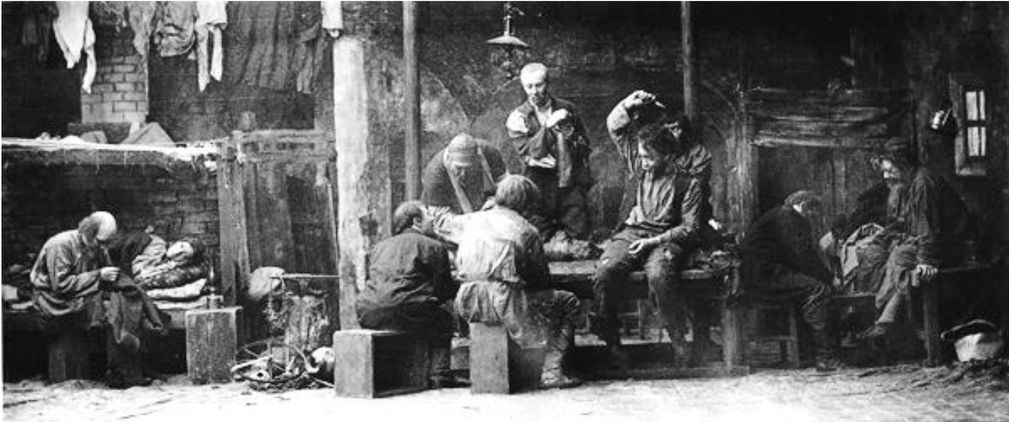
Z inscenace Na dně (MČHT, 1902)