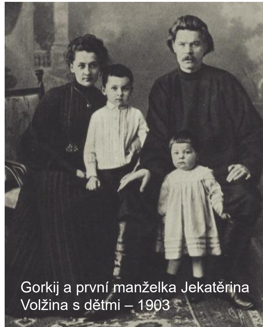
Gorkij a první manželka Jekatěrina Volžina s dětmi – 1903