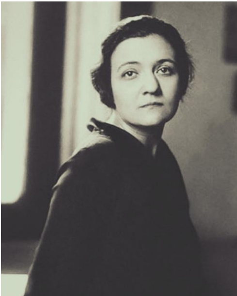
Třetí Gorkého žena – Maria (Mura) Budberg