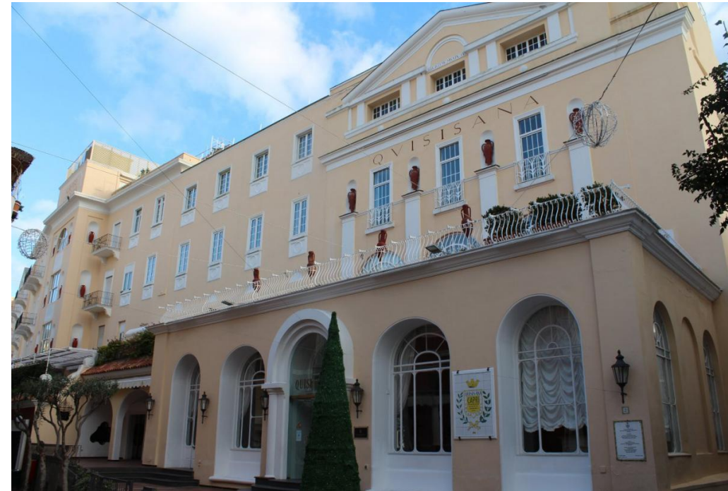
Hotel Quisesana na Capri