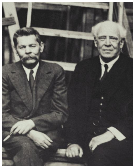
M. Gorkij a K. S. Stanislavskij