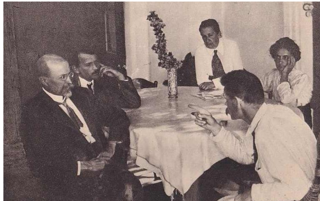
T. G. Masaryk a M. Gorkij