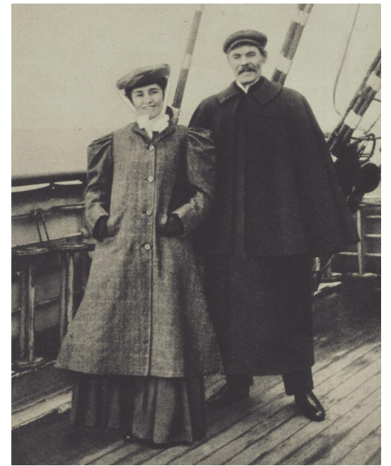
Gorkij a herečka Maria Andrejevová – 1906