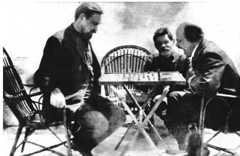
A. Bogdanov, M. Gorkij a V. I. Lenin