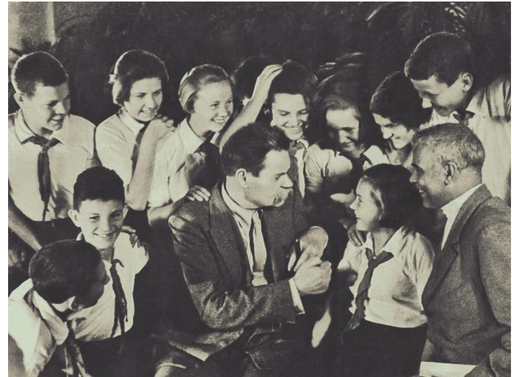
M. Gorkij a sovětští pionýři