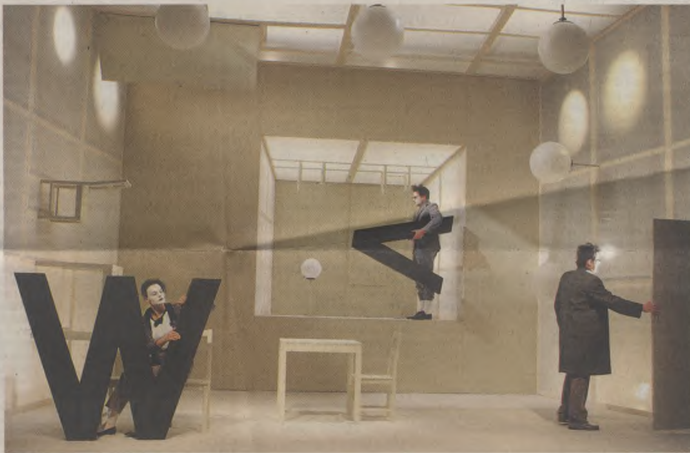
Groteskní a tragické. Životy Voskovce a Wericha ožívají v zdramatizované korespondenci, která vyšla před časem knižně a stala se hitem.