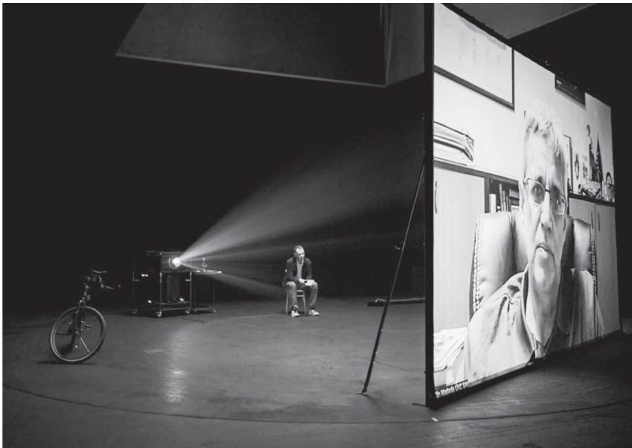
Petra Tejnorová, Marta Ljubková a kol., Sme krajina: Príbeh ľudí, priehrady a času, DJGT Zvolen, 2023.