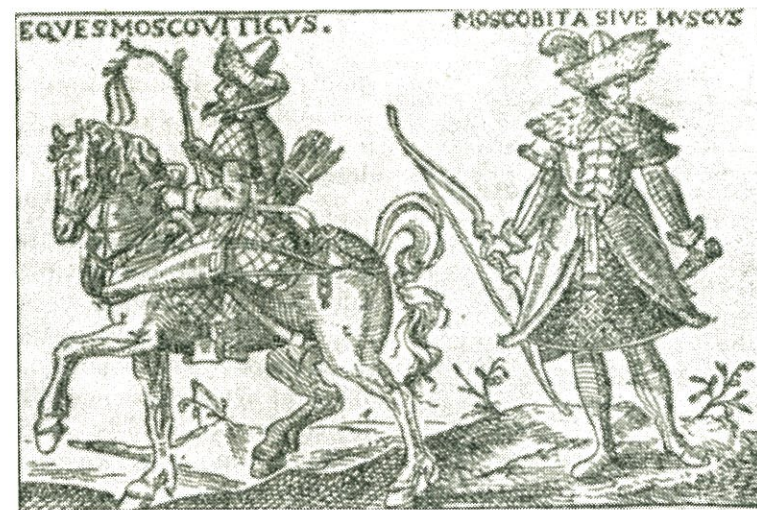
19. Typy moskevských vojáků (rytina ze XVI. stol.).

drancování svatých kostelů a vašich domů, vraždění vašich dětí, hanobení vašich žen a dcer. Jak utrpěly od Turků jiné veliké a slavné země, a to Bulhaři a proslulí Řekové i Trapezund a Amorie 1 i Arbanasi 2 i Charvátsko i Bosna i Mangup i Kaffa i mnoho jiných zemí,