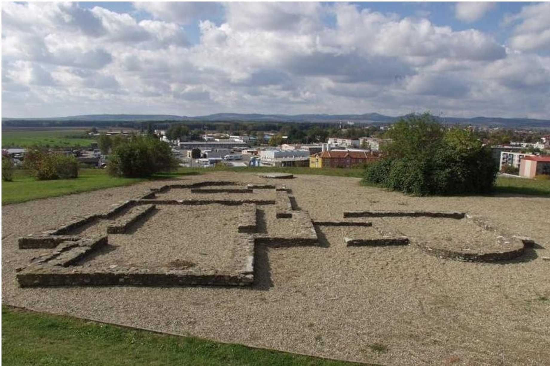
10 Svatí a jejich kult ve středověku