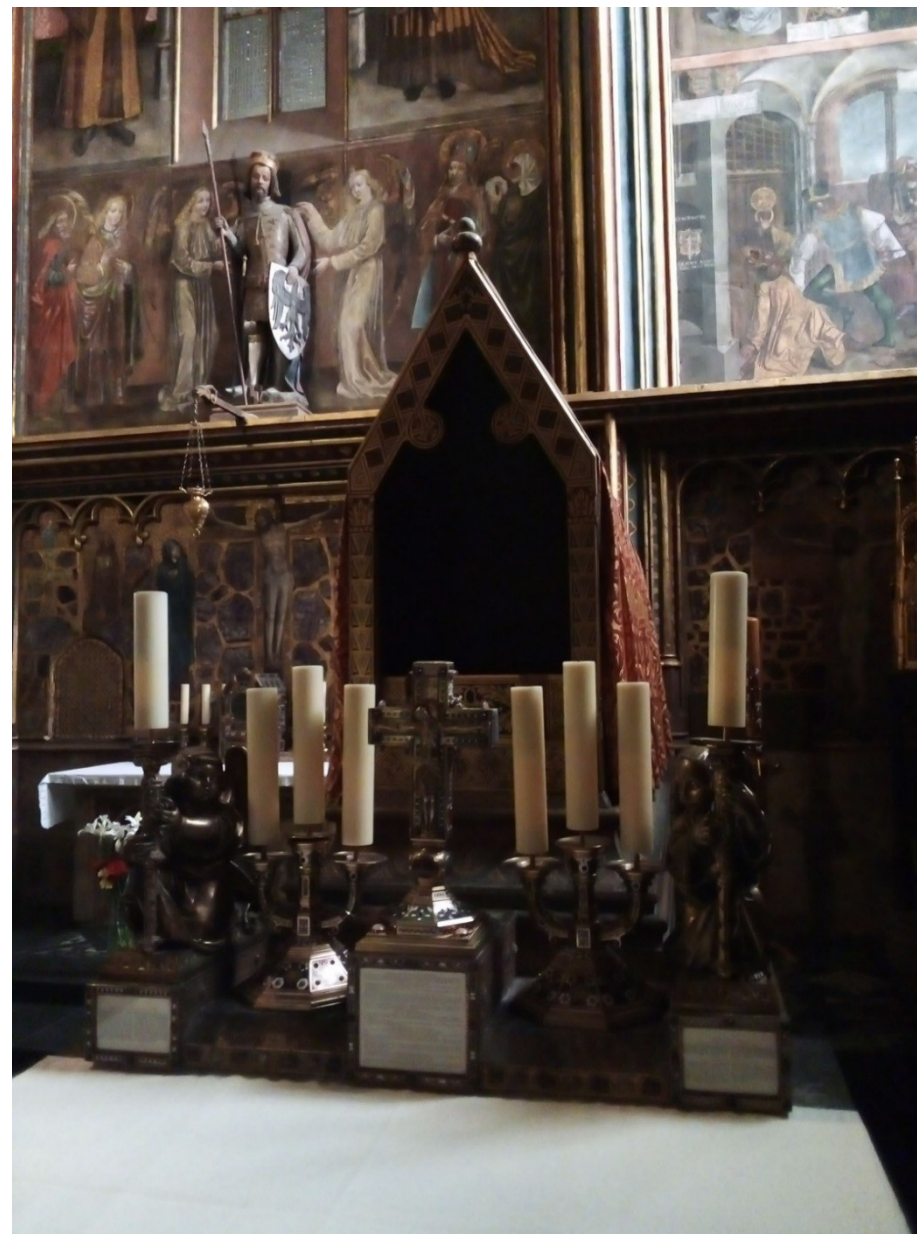
13 Svati a jejich kult ve středověku