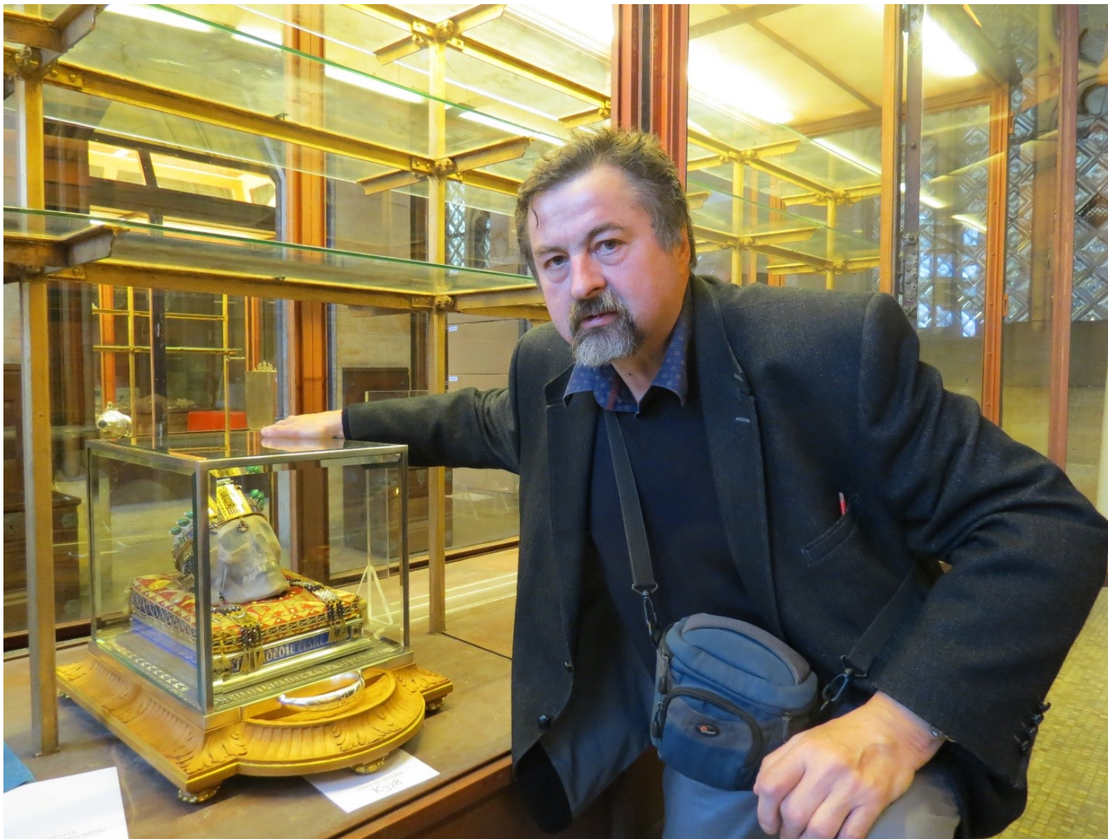
14 Svati a jejich kult ve středověku