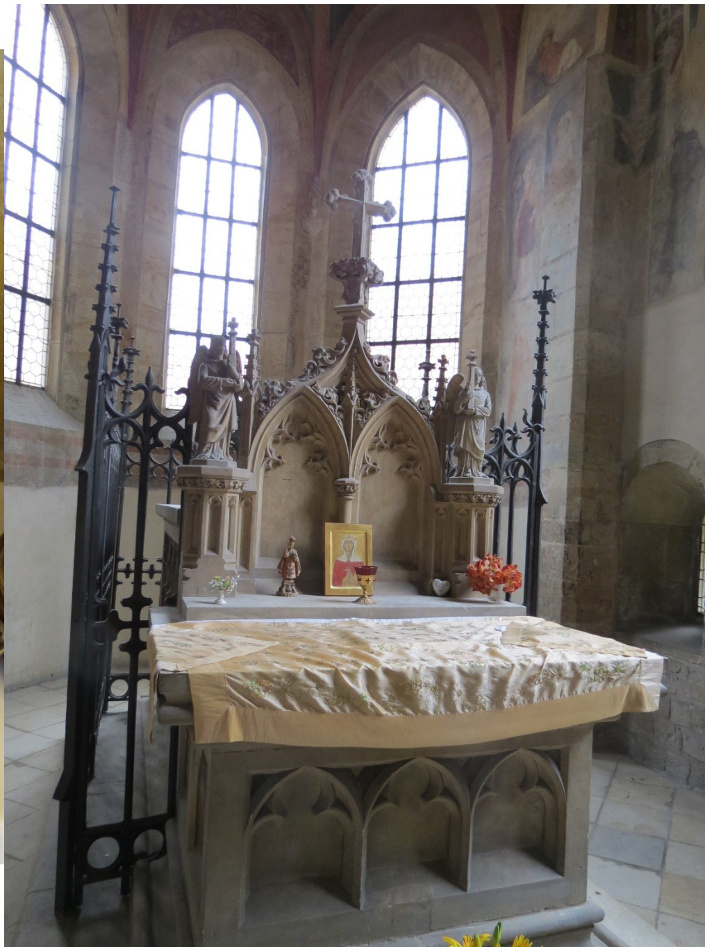
10 Svätí a jejich kult ve středověku