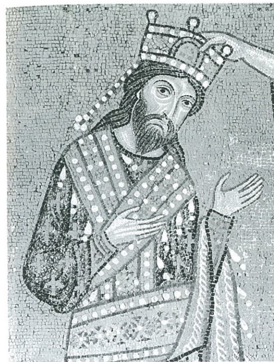
Korunování Rogera II. Sicilského (výřez z mozaiky v nartexu chrámu Martorana v Palermu, polovina 12. stol.)

Soluň byla na počátku občanské války ovládána předním feudálem Synadenem, který byl přívržencem Kantakuzenovým. Byli to právě zeloti, kteří zaktivizovali odpor vůči Kantakuzenovým přívržencům v Soluni, ozbrojili lid a napadli přední feudály ve městě. Jakmile byla vyhnána aristokracie, obrátili se i proti majetným složkám středního stavu. Kantakuzenovo vojsko, které postupovalo k Soluni, bylo nuceno zastavit svůj postup zvláště poté, co se roznesla zpráva, že z Konstantinopole přichází zelotům významná vojenská posila. Ioannes Kantakuzenos, tísněný