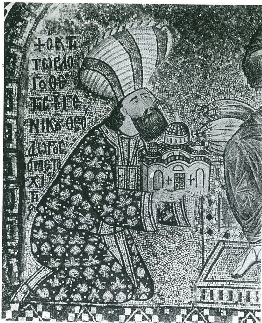
Theodoros Metochites jako donátor. Mozaika v kostele kláštera Chora — Kariye Džami (začátek 14. stol.)

konstantinopolským vojskem, hledal pomoc nejdříve u Srbů a později navázal vážné jednání o vojenské spojení s osmanskými Turky. Turci se pochopitelně chopili nabízené příležitosti rozšířit svůj vliv na území Byzantinců a vyslali v roce 1343 loďstvo před Soluň. Obléhání Soluně trvalo asi deset dní a ukázalo pevnost a sílu vlády zelotů. Město se uhájilo, pokusy o zradu byly v zárodku potlačeny. Nepřátelské vojsko v čele s Ioannem Kantakuzenem se stáhlo do Thrákie i s osmanskými spojenci.