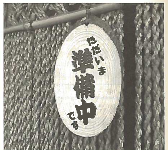
準備中 open later today じゅんびちゆう