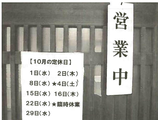
営業中 open えいぎょうちゆう