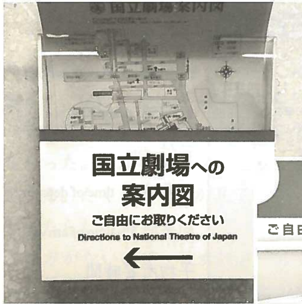
(国立劇場への) 案内図 こくりつげきじょう あんないず

Area Map (with directions to the National Theatre)